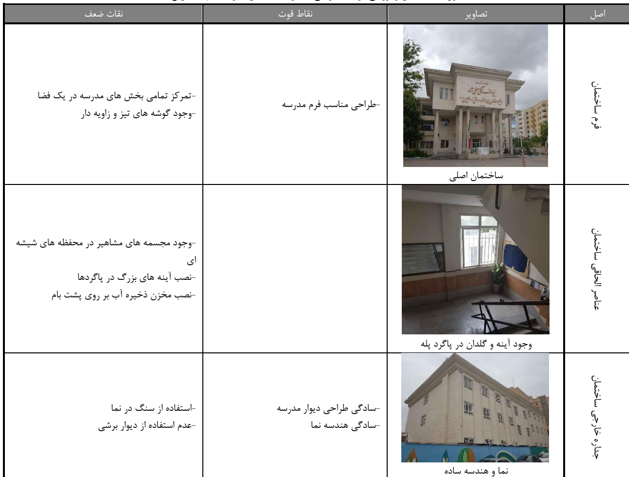
جدول (۲) : تحلیل و بررسی الزامات طراحی معماری ساختمان مدرسه امام حسین(ع)