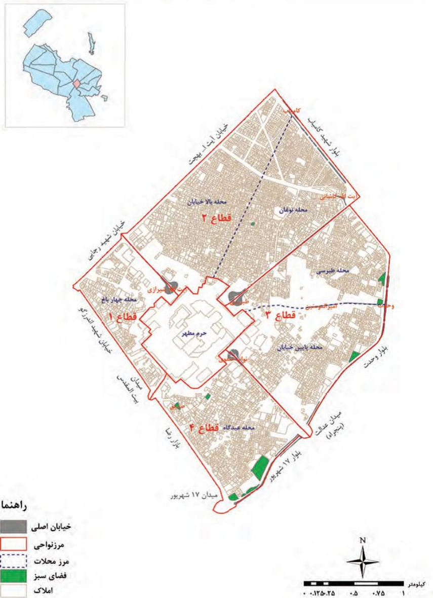
شکل (۲): نقشه منطقه ثامن (آمارنامه شهر مشهد، ۱۳۹۴: ۴۲)