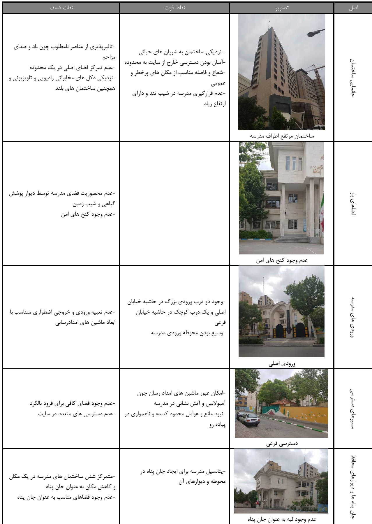
جدول (۱) : تحلیل و بررسی الزامات طراحی محوطه ساختمان مدرسه امام حسین(ع)