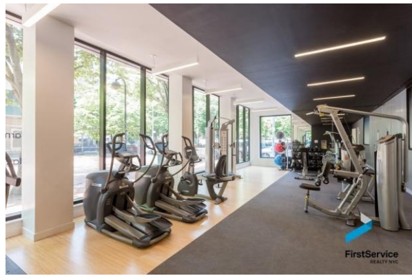
تصویر ۱۱: سالن ورزشی مجتمع کارمل پلیس

فضاها به گونه‌ای طراحی شده‌اند که عملکردهای متنوعی را ارائه می‌دهند و به صورت مرکزی قرار دارند. این امر ارتباط موثر بین ساکنین آپارتمان با جامعه اطراف را تقویت می‌کند. فضاهای معمولی یک خانه در کل ساختمان پراکنده شده است و بدین ترتیب ساکنان را در طول روز ترغیب به تعامل با همسایگان می‌کند (Mears&Ruth, 2019, 22).