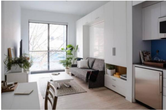
تصویر ۸: فضای داخلی ساختمان کارمل پلیس

اهداف طراحی تیم طراح برای فضای داخلی واحدها، دستیابی به حس جادار بودن و راحتی و کارایی بود، به طوری که حتی وقتی سطح اشغال واحدها را کوچک می‌کنیم تیم معمار برای رسیدن به اهداف ذکر شده اندازه همه چیز به جز مساحت کف را افزایش می‌دهند (Mears&Ruth, 2019, 22).