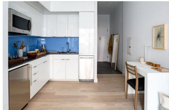
تصویر ۹: فضای داخلی ساختمان کارمل پلیس

مبلمان انعطاف پذیر به کار رفته در واحدها قابلیت تبدیل شدن به کاناپه، تختخواب و همچنین انبار کردن وسایل را داراست (Mears&Ruth, 2019, 22). به واسطه وجود سقف بلند یک فضای ذخیره‌سازی در بالای سقف حمام در نظر گرفته شده است.