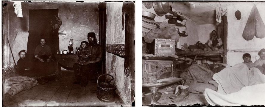
تصویر ۱: زاغه‌نشینان نیویورک

یک سابقه تاریخی برای ساختمانهای میکرو، هتل‌های یکنفره SRO هستند که در اوایل دهه ۱۹۰۰ در سراسر شهرهای آمریکا ساخته شدند. SRO نوعی مسکن برای کارگران موقت در شهرها بود که انعطاف‌پذیری در اجاره‌نشینی را می‌خواستند و همچنین به مکانی نزدیک به محل کار خود برای زندگی نیاز داشتند. این نوع مسکن را می‌توان به عنوان مسکن جزئی تلقی کرد که فاقد آشپزخانه‌های خصوصی کامل و تاسیسات لوله‌کشی در واحدها بودند (Geffner, Thomas, 2018, 5). یک قرن پیش از ساخته شدن اولین آپارتمان میکرو در آمریکا اصلاحاتی در سیاستهای مسکن در شهر نیویورک آغاز شد. یکی از تاثیرگذارترین افراد در اصلاح این سیاستها در قرن گذشته روزنامه‌نگاری به نام جیکوب رایس بود. او در سال ۱۸۹۰ از دانمارک به آمریکا مهاجرت کرد و بدترین جنبه‌های شهرنشینی آمریکا را در اقامتگاه‌های ارزان قیمت تجربه کرد. این امر در نهایت به مهاجر دانمارکی الهام بخشید تا خود را وقف بهبود شرایط زندگی برای طبقه پایین شهر کند. او با دوربین فلش‌دار که به تازگی اختراع شده بود توانست زاغه‌های نیویورک و زندگی وحشتناک زاغه‌نشینان را مستند کند (Stamp, Jimmy, 2014).