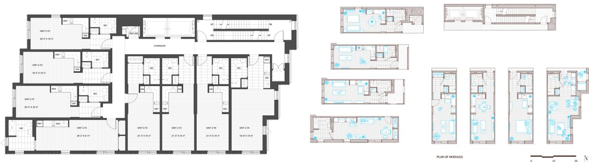
تصویر ۶: پلان تپ طبقات ساختمان کارمل پلیس

معماران پروژه هفت نوع واحد مختلف را برای سلیقه‌ها و نیازهای متفاوت کاربران طراحی کردند.