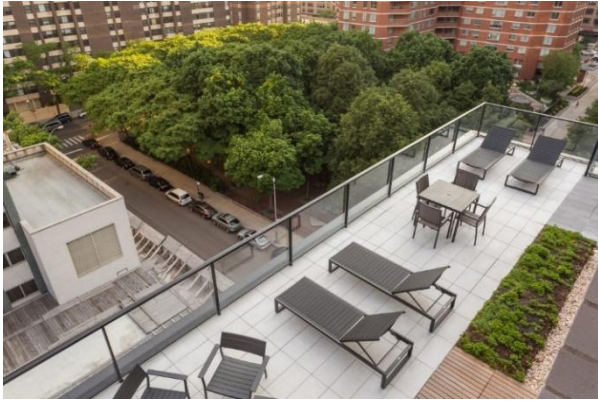
تصویر ۱۱: فضای بام مجتمع کارمل پلیس