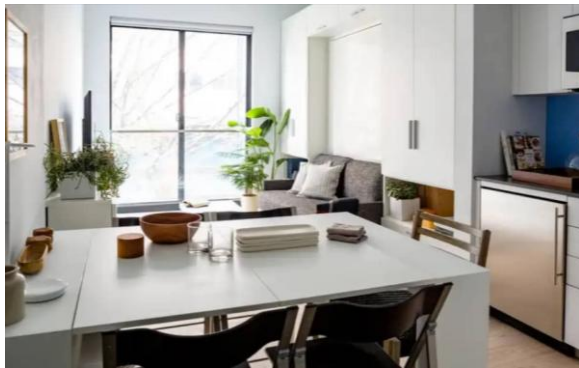
تصویر ۱۰: فضای داخلی ساختمان کارمل پلیس

استفاده بهینه از فضا، در نظر گرفتن سقف بلند، بکارگیری مبلمان چندمنظوره و انعطاف پذیر، وجود نور طبیعی به واسطه وجود پنجره بزرگ، فضای داخلی دلچسب و کارآمدی را برای واحدهای آپارتمان به ارمغان آورده است.