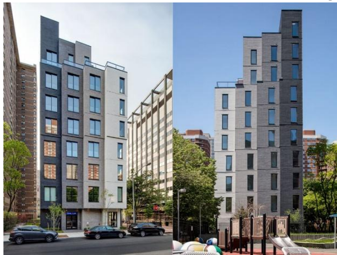
تصویر ۲: نمای بیرونی ساختمان کارمل پلیس

پروژه کارمل پلیس ۲ برنده این رقابت شد. این آپارتمان استانداردهای جدیدی را به عنوان نمونه‌ی اولیه برای زندگی خردآرانه کرد. می‌توان این پروژه را اولین پروژه از آپارتمانهای میکرو به شکل امروزی در شهر نیویورک دانست. این پروژه توسط شرکت این آر شیتکت ۳ طراحی و ساخته شد. آپارتمان شامل ۵۵ واحد است که متراژ واحدها بین ۲۴ مترمربع تا ۳۳ مترمربع است و کاملاً مدولار ساخته شده است. معماران پروژه توانستند با در نظر گرفتن ابعاد استاندارد، حداقل ابعاد یک واحد مسکونی را کاهش دهند. این ساختمان نه طبقه به عنوان گزینه جدیدی در راستای پاسخگویی به رشد روز افزون جمعیت و همچنین روند رو به رشد خانواده‌های کوچک شهر مطرح شد. تیم ساخت و ساز روش مدولار را برای ساخت این آپارتمان استفاده کرد. این امر اجازه داد تا پایه‌های ساخته شده در سایت نصب شود در حالیکه واحدها در کارگاه دیگری ساخته می‌شدند. این روش ساخت و ساز به طرز چشمگیری سر و صدا و اختلال در محدوده سایت را کاهش داد.