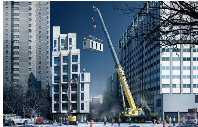
تصویر ۵: ساخت واحدهای برج کارمل پلیس در کارگاه