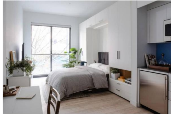
تصویر ۷: فضای داخلی ساختمان کارمل پلیس

استفاده بهینه از فضا، در نظر گرفتن سقف بلند، بکارگیری مبلمان چندمنظوره و انعطاف پذیر، وجود نور طبیعی به واسطه وجود پنجره بزرگ، فضای داخلی دلچسب و کارآمدی را برای واحدهای آپارتمان به ارمغان آورده است.