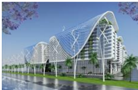
شکل شماره (۶) : مجتمع چند منظوره_ منبع : (www.google.com)