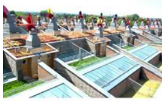
شکل شماره (۷) : مجتمع : مجموعه بدینگتون