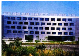
شکل شماره (۸) : ساختمان نیبر نورث .