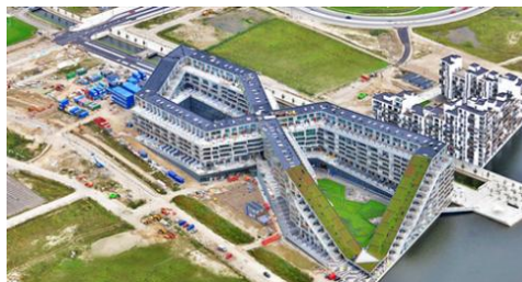
تصویر شماره (۲)

۳-۵- مجتمع سولر: این برج ۲۷ طبقه ۵ درصد انرژی مورد نیاز خودش را از ۳۳۰ متر مربع سلول فوتولتایی که در قسمت غربی نما نصب شده تامین می‌کند. از آنجا که سلول‌های فوتولتایی در ضلع غربی ساختمان واقع شده است (یعنی از افتاب بعد از ظهر طولانی برخوردار است) بنابراین قسمت اعظم دریافت انرژی خورشید می‌تواند در ماه‌های تابستان حاصل گردد و این امر اتفاقاً در زمانی است که کولرهای گازی با شدت بیشتری کار می‌کنند. پنجره‌ها به شیشه‌های کم‌گسیل مجهزند به نحوی که امکان عبور نور خورشید را به خوبی فراهم می‌کند. اما جلوی وارد شدن انرژی گرمایی را می‌گیرد به همین ترتیب از رنگ‌هایی که گازهای کمتری متساعد می‌کنند بهره برداری شده و مواد به کار رفته کف پوش بازیافتی‌اند. سامانه بازیابی آب در لوله کشی ساختمان و واحدهای بهداشتی ملحوظ شده است. تاسیساتی آب کثیف در زیرزمین را به آب قابل مصرف در سیفون‌های توالت و نیز در برج خنک کن تبدیل می‌کند. این آب برای آبیاری فضای سبز بام در تابستان عمل خنک سازی را انجام می‌دهد و در زمستان به عنوان عایق عمل می‌کند. منبع آبی برای جمع‌آوری آب باران تعبیه شده تا فضای سبز بام را در زمان بعدی آبیاری کند (استنگ، ۱۳۹۴).