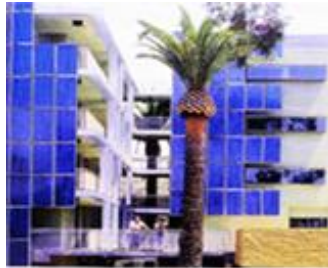
تصویر شماره (۱): نمای مجتمع مسکونی

۳-۴- خانه ۸ آپارتمان‌ها این مجموعه شامل خانه‌های ویلایی، آپارتمانی و پنت‌هاوس‌ها در ارتفاع بالاتری طراحی و ساخته شده‌اند. گوشه‌ی شمال شرقی ساختمان، دارای ده طبقه است که تدریجاً در رسیدن به کنج مخالف (جنوب غربی) در شبی پایین رفته، به یک طبقه کاهش می‌یابد. دلیل این امر آن است که این بخش همچون سدی بود که حالا، با کاهش ارتفاع آن، تعداد بیشتری از واحدهای مسکونی به صورت گسترده تری از نور آفتاب و چشم انداز زیبای پیش رو بهره مند خواهند شد. بنا دارای ۲ حیاط داخلی است که به طرز زیبایی طراحی شده است و مانند پارکی بسیار زیبا برای اهالی، مرکزی تفریحی است. این نوع طراحی ما را قادر می‌سازد تا فضاهای باز خصوصی بیشتری داشته باشیم. دو بام سبز شیبدار بالغ بر ۱۷۰۰ متر مربع به صورت استراتژیک برای کاهش گرمای شهری بر روی سقف آن قرار دارد (فرجی اصل، ۱۳۹۴).