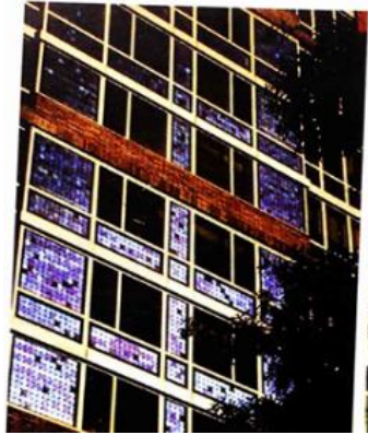
شکل شماره (۳): نمای مجتمع مسکونی سولر