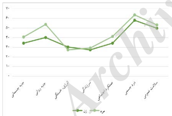
نمودار ۱- مقایسه میانگین ابعاد کیفیت زندگی در کارکنان برحسب جنسیت

مقایسه میانگین کیفیت زندگی در زنان و مردان در ابعاد مختلف در نمودار ۱ نشان داده شده است. در تمامی ابعاد به غیر از بعد سرزندگی میانگین نمره کیفیت زندگی در مردان بیشتر از زنان بوده است (P-Value=۰/۰۵).