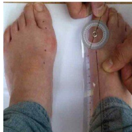
شکل ۳- روش اندازه‌گیری زاویه شست کج

همان طور که در جدول ۴ ملاحظه می‌شود، بین وزن، شاخص توده بدنی، پهنای پا و میزان افت استخوان ناوی با زاویه شست کج ارتباط مثبت و معناداری وجود دارد ( P \leq 0.05 ). طبق مقیاس کوهن تنها ارتباط بین افت استخوان ناوی و زاویه شست کج ارتباط قوی را نشان می‌دهد و ارتباط سایر متغیرها و زاویه شست کج طبق مقیاس کوهن ارتباط متوسطی