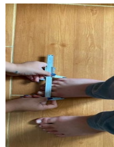
شکل ۱- روش اندازه‌گیری پهنای قسمت قدامی پا

برای اندازه‌گیری قد و وزن از دستگاه دیجیتال سکا (۲۸۴) و برای محاسبه شاخص توده بدنی از تقسیم وزن (کیلوگرم) بر مجذور قد (متر) استفاده شد. به منظور اندازه‌گیری طول پا از روش ترسیم نقش پا استفاده شد. در این روش، ابتدا نقش پا بر روی کاغذ A4 ترسیم شده و سپس با استفاده از خطکش فاصله بین مرکز پاشنه تا نوک انگشت دوم پا به سانتی‌متر اندازه‌گیری شد. جهت ارزیابی پهنای قدامی پا با استفاده از کولیس فاصله بین داخلی‌ترین و خارجی‌ترین قسمت قدامی پا ارزیابی شد (۴) (شکل ۱).