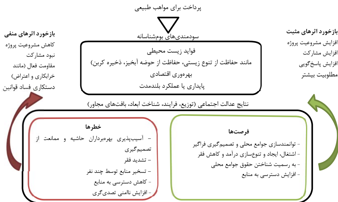
شکل ۲- طرح پرداخت برای خدمات‌های بوم‌نظام (۲۱).