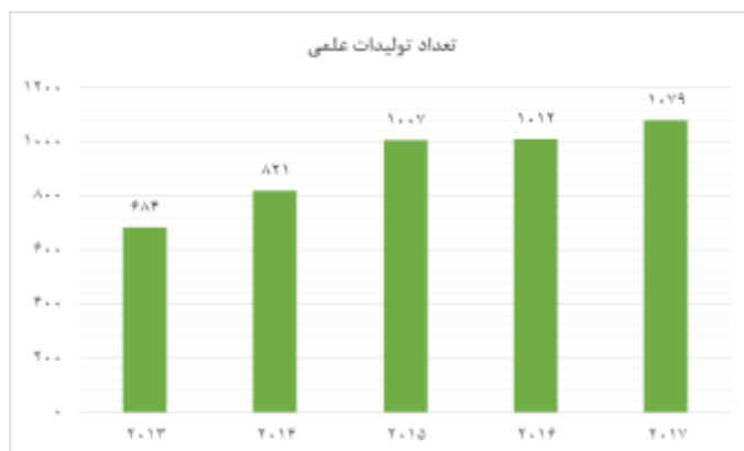
نمودار ۱- روند رشد تولیدات علمی طی سال‌های ۲۰۱۳-۲۰۱۷

مربوط به سال ۲۰۱۷ با ۱۰۷۹ رکورد می‌باشد.