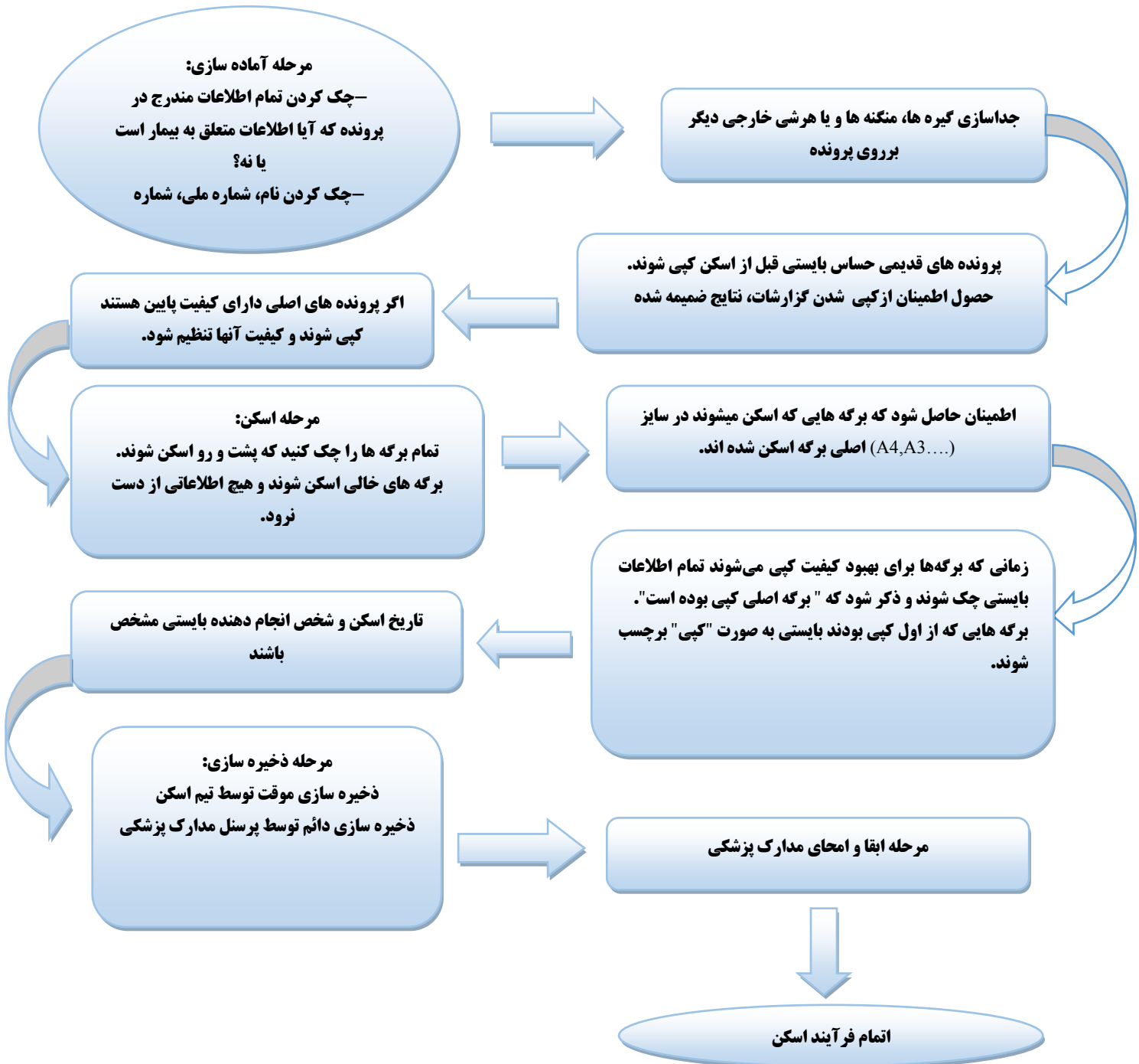
شکل ۲- نمایش مراحل فرآیند اسکن مدارک پزشکی (۱۸)

از ماشین‌های مخصوص و تشخیص ماشینی) توسط تیم اسکن‌کننده انجام شود. در اینجا نمونه‌ای از مراحل که بیشتر مورد استفاده قرار