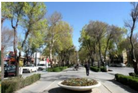
۱۱-خیابان چهار باغ اصفهان ۱۲- میدان دروازه شیراز (میدان آزادی) اصفهان