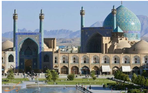
۳- مسجد امام اصفهان

مرمرین بود با ده پا (۳/۵ متر) بلند و سه پا (حدود یک متر) پهنا بر روی دیوار جنوب غربی رواق قرار گرفته بود. مسجد امام، ساختمان عظیم داشت که گفته می‌شود ۱۸۰۰۰۰۰ آجر و ۴۷۵۰۰۰ کاشی در آن به کار رفته است» (استین پی، ۱۳۸۰، ۱۵۳).