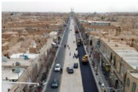
۸- هتل پارسيان صفائیه یزد