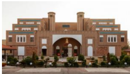
۷- نمای خیابان قیام یزد ( http://yazdfarda.com )