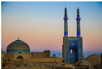
۴-مسجد جامع یزد

اقداماتی در سال ۱۳۲۴ شمسی توسط حامیان مسجد جامع کبیر شروع شد» (حسینی، ۱۳۹۲، ۳۵). این بنا به شیوه چهار ایوانی است، که اوج سنت مسجد سازی هزار ساله ایران است. «مسجد دارای شش ورودی است که در اضلاع مختلف بنا واقع شده اند. نمای ایوان رفیع با مجموعه‌ای از زیباترین تزیینات کاشی معرق و با نقوش اسلیمی و گیاهی و نیز گره چینی پوشانده شده. این تزیینات همراه با آجرهای ضربی و نقوش معلقی و کتیبه‌های کاشی معرق و کوفی بنایی مجموعه‌ای بدیع و خیره کننده آفریده اند. گنبد خفته با طرح گل صابونکی معلقی پوشیده شده اند. فاصله این فیلیوشها ۱ نیز با کاربندی زیبایی که بر آنها با خطوط کوفی بنایی کلمات الله و محمد نقش بسته، کار شده است. گنبد زیبای مسجد از نوع دو پوسته بوده و بر آن نقش گل صابونکی معلقی با ظرافت اجرا شده و بر ساقه آن کلمه الملک لله به خط کوفی تکرار شده است. در ضلع غربی و شرقی گنبد خانه دو شبستان یا تابستانه وجود دارد. شبستان دارای محراب کم عمق است که در راس دارای مقرنس گچی بوده و کمی پایین تر از آن هشت قطعه قاب کاشی معرق به یک اندازه در کنار هم نصب شده است. یک کتیبه معرق نیز به ابعاد ۵۸*۱۰۸ سانتیمتر در پایین و در وسط محراب نصب است که بر آن جملات قرآنی و نقوش گل و گیاه با تکنیک کاشی معرق اجرا شده است. محراب شبستان غربی ساده و دارای مقرنس‌های گچی در نیم طاق آن است» (خادم زاده، ۱۳۸۴، ۹۱-۹۰)