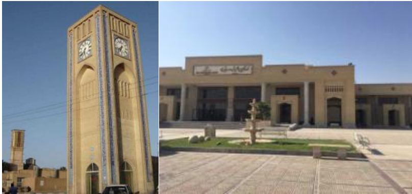
۶- میدان وقت یزد