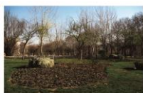
طراحی فضای پارک ویژه با استفاده از نقش‌های تزئینی مساجد