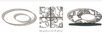
فرم های کار شده در طراحی فضا