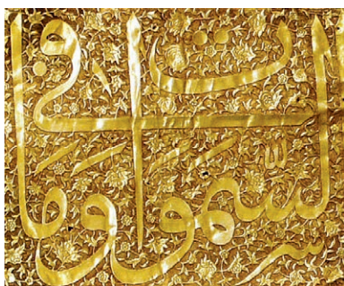
قرینه سازی، موازنه حروف و استفاده از حروف کشیده

آیه الکرسی آیه ۲۵۵ و به روایت برخی مفسران آیات ۲۵۵ تا ۲۵۷ سوره بقره، دومین سوره قرآن مجید است. در قرآن تنها یک مورد از کرسی خداوند سخن به میان آمده و آن همین آیه است: «وسع کرسیه السموات والارض» / کرسی او به پهنای آسمان ها و زمین است. اشتهار این آیه به دلیل همین عبارت است. این آیه در زمان پیامبر اکرم(صل الله علیه و آله و سلم) نیز به همین نام معروف بوده است. پیامبر (صل الله علیه و آله و سلم) فرمود با عظمت ترین آیات قرآن آیه الکرسی است. سرور سخن ها قرآن است و سرور قرآن سوره بقره است و سرور سوره بقره آیه الکرسی است. این آیه در میان مسلمانان همیشه مورد توجه و تعظیم خاصی بوده و علت آن است که همه معارف و تعالیم اسلام بر اساس توحید استوار است و در آیه الکرسی توحید به جامع ترین شکل و در نهایت ایجاز و اختصار بیان شده است. در این آیه