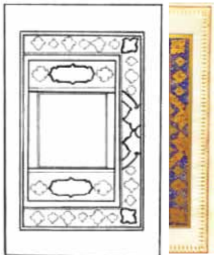
جدول ۲. شناسنامه قرآن ۳۹. کتابخانه موزه ملی ملک. تصویر ۵. کتیبه متن قرآن ۳۹. شکل ۱. تحلیل خطی قرآن ۳۹. تصویر ۶. حاشیه قرآن ۳۹.