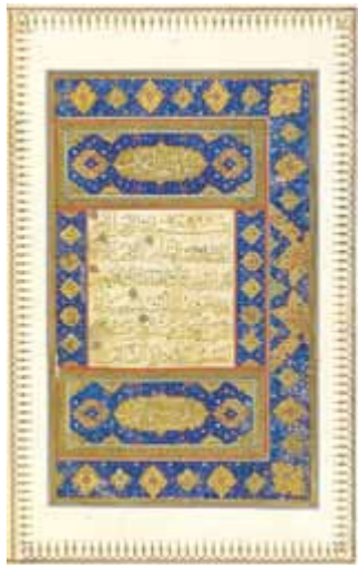
تصویر ۴. صفحه فاتحة الكتاب قرآن شماره ۳۹.