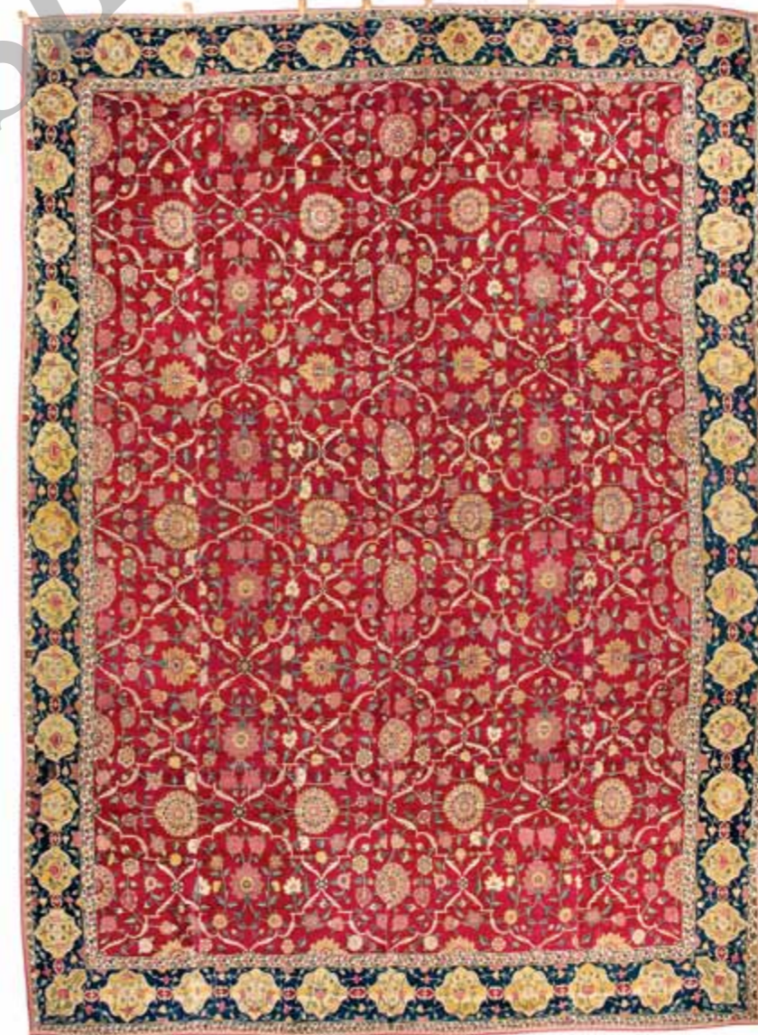
تصویر ۴: قالی هندی مغولی، بافته شده در دربار امپراطوران مغولانی هند، موزه فرش آستان قدس رضوی.

با نقوش گل شاه عباسی، گل‌ها، برگ‌ها و شاخه‌های ختایی تزیین شده است. نمونه ۳: قالی افشان بندی (هندی مغولی) تاریخ بافت: قرن ۱۱ ق واقف: پادشاهان صفوی اندازه: ۵۴۶×۳۹۶ س.م نوع رنگ: طبیعی مشخصات کلی: رجشمار این قالی ۴۵ گره در ۶/۵ س.م با گره فارسی (نامتقارن)؛ تار و پود این قالی از ابریشم، پرز آن از پشم. ملاحظات: قالی هندی مغولی در زمان جهانگیر از سلاطین سلسله مغولی هند در کارگاهی وابسته به دربار