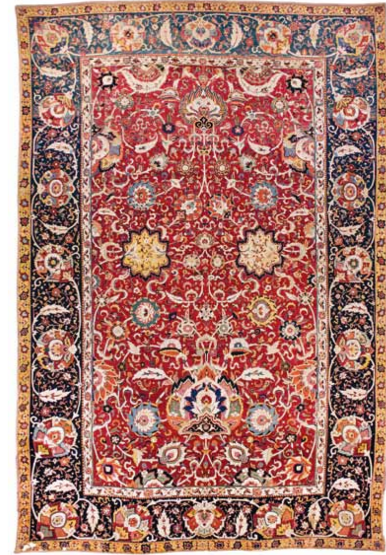
تصویر ۲. قالی افشان شاه عباسی گل‌بنتون دار موزه فرش آستان قدس رضوی

معرفی چند تخته از قالی‌های دوره صفویه در موزه فرش آستان قدس رضوی [۲] نمونه ۱: قالی افشان شاه عباسی گل‌بنتون دار تاریخ بافت: اواخر قرن ۱۰ ق واقف: شاه عباس اول صفوی اندازه: ۵۵۵ × ۳۵۵ س.م رنگ بندی: طبیعی مشخصات کلی: رجشمار ۴۰ در ۶/۵ سانتیمتر با گره فارسی (نامتقارن) - تار از ابریشم، پود از پنبه و گل‌بنتون، پرز از پشم مشخصات توصیفی: قالی افشان شاه عباسی گل‌بنتون‌دار که که شاه عباس اول صفوی به حرم مطهر اهدا کرده است از قدیمی‌ترین قالی‌های موزه آستان قدس رضوی است. متن قالی به‌صورت ۱/ طراحی و در مشهد بافته شده است. بافت این قالی به‌صورت برجسته است که به مرور زمان، پرزهای آن ساییده و هم سطح قسمت‌های گلیم بافت گل‌بنتون‌دار [۳] آن شده است. رنگ متن آن قرمز تیره و کاملاً طبیعی است. گل‌های شاه عباسی برگ‌کنگری بسیار بزرگ به همراه اسلیمی‌های ابری و همچنین الیاف فلزی به‌کار رفته در بافت آن از شاخصه‌های این قالی است. استفاده از نخ گل‌بنتون برای بافت قسمت‌هایی از این قالی بر نفاست و زیبایی این قالی افزوده است. قالی دارای سه حاشیه تزیینی است و حاشیه