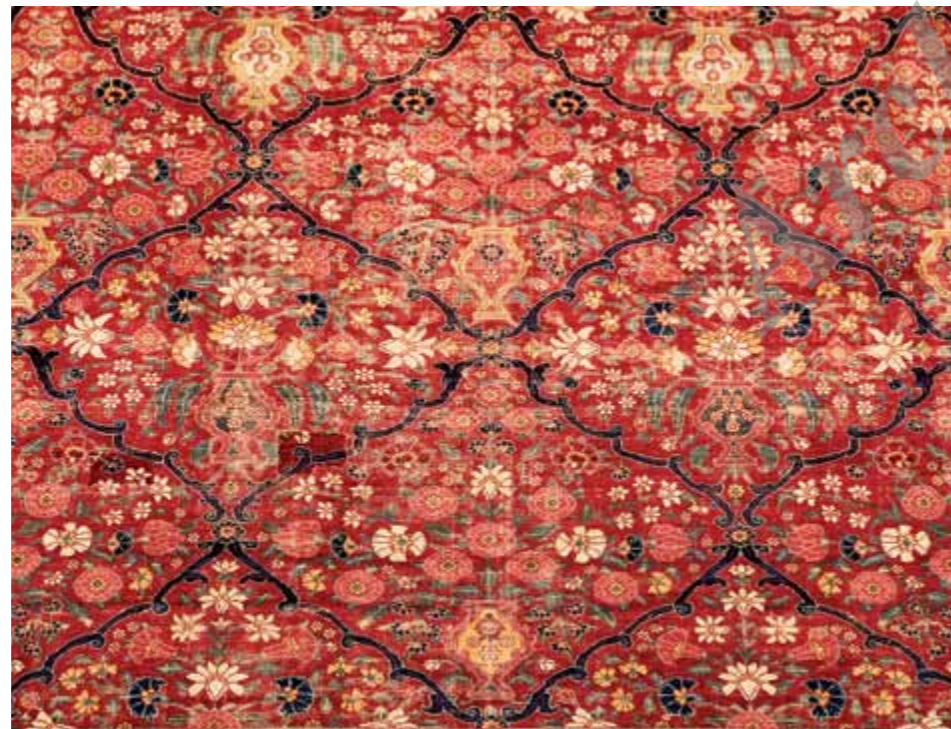
تصویر ۵: قالی بندی گلدانی (مشبک)، موزه فرش آستان قدس رضوی

نمونه ۴: قالی بندی گلدانی (مشبک) تاریخ بافت: اوایل ۱۰ ق واقف: نامشخص اندازه: ۵۷۵×۸۰۰ س.م نوع رنگ: طبیعی مشخصات کلی: رجشمار قالی ۴۵ گره در ۶/۵ س.م با گره فارسی (نامتقارن) - تار از ابریشم، پود از پنبه، پرز از پشم مشخصات توصیفی: این قالی با مساحت ۴۶ مترمربع در حال حاضر بزرگ‌ترین فرش این مجموعه و از زیباترین قالی‌های موجود محسوب می‌شود. طرح آن دارای بندهای اسلیمی شکل منظم و زیبایی به رنگ سرمه‌ای است که بر روی زمینه قرمز جلوه‌ای خاص دارد. داخل هر قاب با گلدانی از گل فرنگی به همراه گل‌ها و برگ‌های زیبا به رنگ‌های قرمز، سبز، سورمه‌ای، کرم و... تزیین شده است. حاشیه بزرگ آن به رنگ آبی تیره است که طرح قاب قابی دارد و درون قاب‌های آن با گل‌های گرد، شاه عباسی و گل‌هایی از جنس گل‌های متن مزین شده که اکنون کاملاً دچار ساییدگی و فرسایش شده است. این قالی زیبا در کرمان بافته شده و رنگ‌های آن همه گیاهی است.