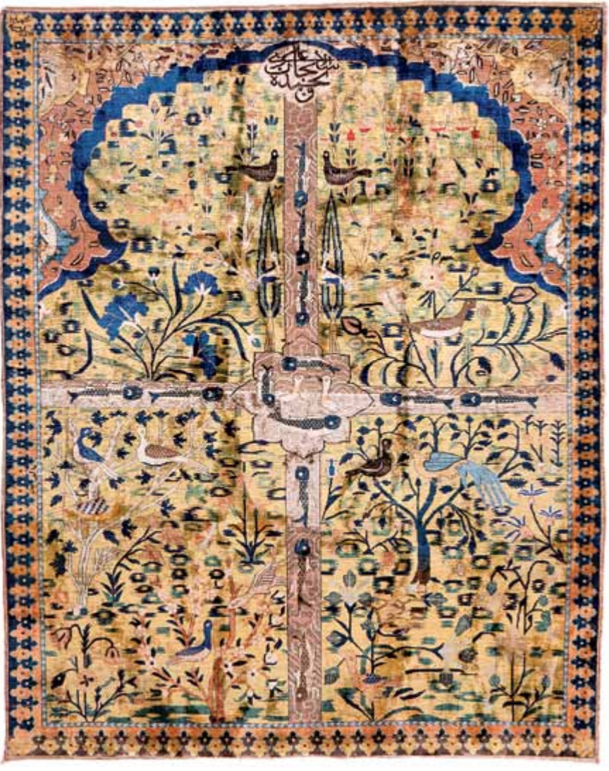
تصویر ۳. سجاده محرابی - باغی، دوره صفوی، موزه فرش آستان قدس رضوی

در طول و عرض نهرها مجموعاً ۱۳ ماهی در اندازه‌های بزرگ به همراه ۲ مرغابی دیده می‌شوند. ماهی نماد حاصلخیزی و باروری است. (جیمز هال، ۱۳۸۰: ۱۰۰) نماد تکوین، تجدید، حفظ حیات و تداعی گر همه مفاهیم ایزد بانوی مادر در نقش زاینده و همه ایزدان قمری است. همچنین نماد پارسایان و مریدانی است که در آب‌های حیات شنا می‌کنند. ماهی‌ها در کنار پرندگان با ایزدان در جهان زیرین و آیین تدفین پیوند دارد و مظهر امید به رستاخیز هستند. (جی. سی. کوپر، ۱۳۸۲: ۳۴۲) در طاق محراب در داخل کتیبه‌ای عبارت «سبحان ربی الاعلی و بحمد» نوشته‌اند همه رنگ‌های مورد استفاده در این سجاده گیاهی است و بیشتر آن‌ها عبارت است از: سبز زرد، سبز آبی تیره، نارنجی، زرد، قهوه ای، سورمه ای، آبی تیره، لاک، سفید، زرد است که به قالی‌های پلوزنی که