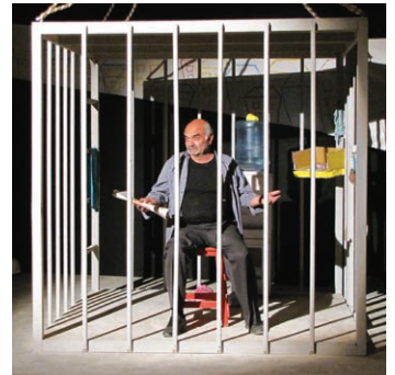
نمایش بچه‌های بهشت

نمایش «پدران» به نویسندگی آرش عباسی و کارگردانی امیر بشیری، از پرافتخارترین نمایش‌های رضوی مشهد در سال ۱۳۸۹ بود که حضور پررنگی نیز در رویدادهای مختلف تئاتر کشور داشت. از آن جمله می‌توان به حضور در هفتمین جشنواره سراسری تئاتر ماه (تهران)، پانزدهمین جشنواره سراسری دانشجویان تئاتری و غیرتئاتری قرآن و عترت (اراک) و چهاردهمین جشنواره بین‌المللی تئاتر دانشگاهیان ایران