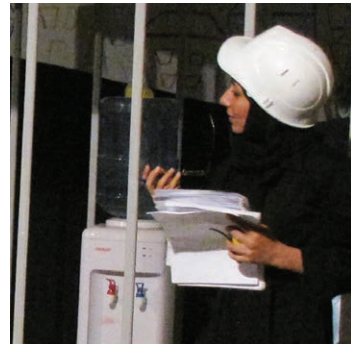
نمایش بچه‌های بهشت