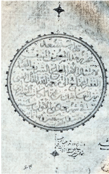
تصویر ۳. ترنج پایانی مصحف وقفی جهانگیر، کاتب زین العابدین شیرازی، تاریخ کتابت ۸۷۶ هـ.ق، محل نگهداری: گنجینه قرآن آستان قدس رضوی، مأخذ تصویر: گلچین معانی، ۱۳۴۷: ۱۴۹.