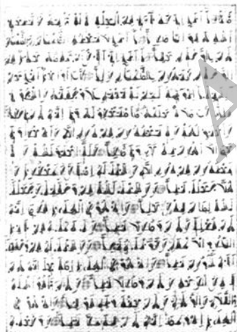
تصویر ۱. صفحه‌ای از مصحف بابر. مصحفی که بابر به خط اختراعی خویش نوشت، محل نگهداری: گنجینه قرآن آستان قدس رضوی، مأخذ تصویر: گلچین معانی، ۱۳۴۷: ۱۷۹.

در این مجموعه مصحفی دیگر نیز نگهداری می‌شود که به خط ابداعی بابر، بنیانگذار این سلسله است و دو ویژگی متمایز دارد: یکی اینکه آن را بابر خود شخصاً کتابت کرده و دیگر اینکه خط به کار رفته در کتابت آن خطی رمزی و ابداعی است؛ البته این اثر را شاه سلطان حسین صفوی بر حرم امام رضا (علیه السلام) وقف کرده است.