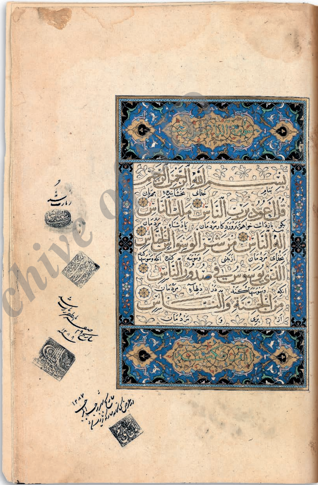
تصویر ۶. جزییاتی از صفحه پایانی متن قرآن در مصحف وقفی جهانگیر شامل ضرب مهرها و یادداشت‌های افزوده.