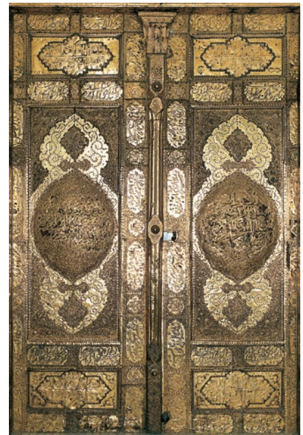
در طلای ملمع تقدیمی ناصرالدین شاه قاجار

بر آستانه آن بنده‌ای است بی‌مقدار (اعتماد السلطنه، ۳۷۳)