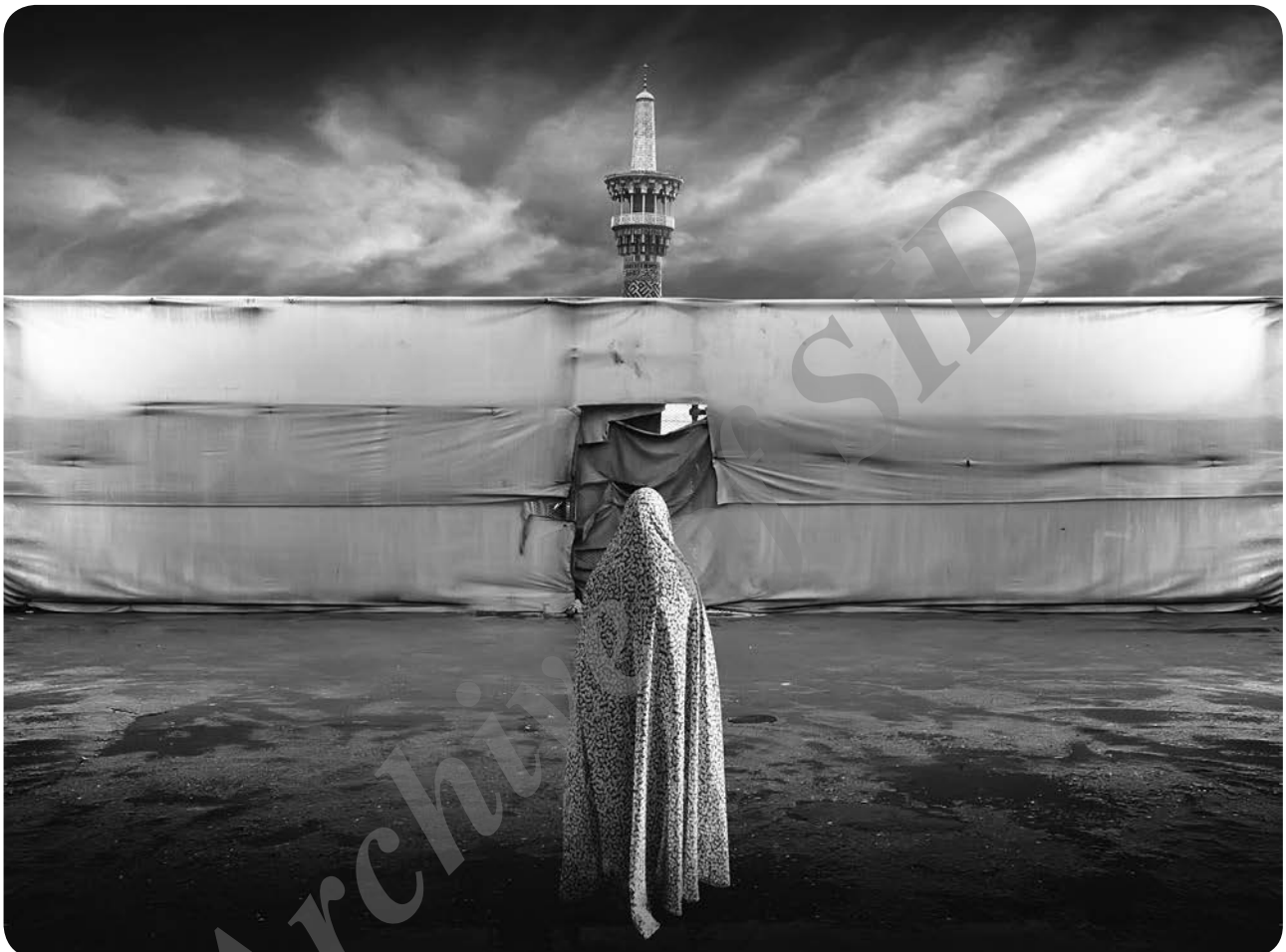
عکس از: شادی آفرین آرش (جشنواره ملی عکس خانه دوست)

گزیده‌ای از داستان‌های جشنواره ملی داستان نویسی رضوی (کبوتر حرم)