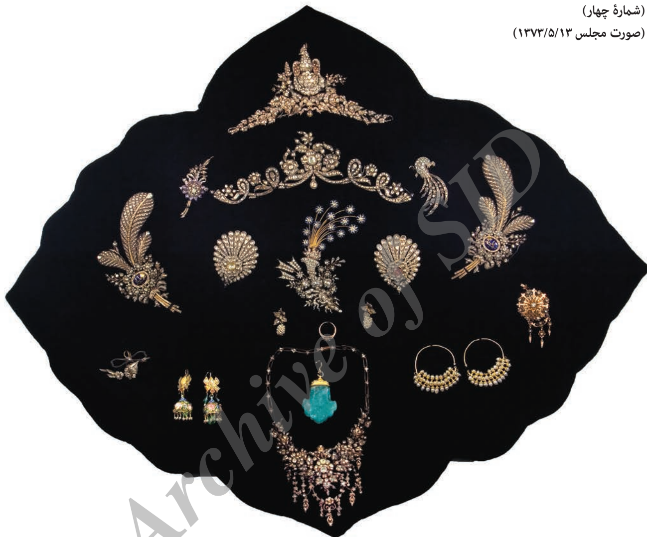
ل) اشیای تزیین بالاسر مبارک (شماره چهار) (صورت مجلس ۱۳۷۳/۵/۱۳)