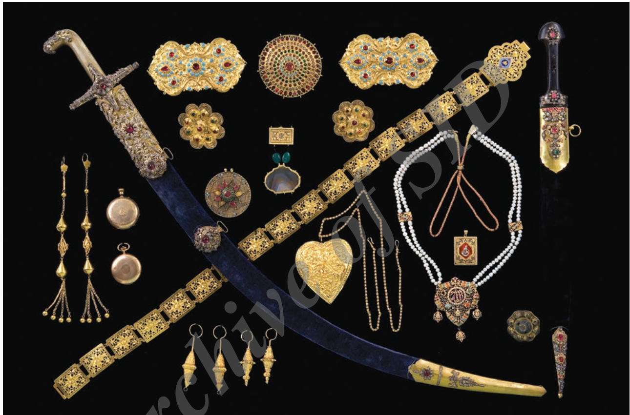
هـ) صورت ریز جواهرات خوانچه پیش روی مبارک (خوانچه شماره ۵ سمت راست) (صورت مجلس ۱۳/۵/۱۳۷۳)

الماس، تسمه فولادی با قبضه مطلقاً، سر و انتهای غلاف مطلقاً و نگین نشان با دو بادامی نگین نشان، نگین‌های الماس (پنج نگین کسر است که از نگین‌های باز شده خزانه تأمین شده است) / یک قبضه ۱۵- گوشواره مخروطی شکل / چهار عدد ۱۶- گوشواره‌های آویز بلند با چهار منگوله در پایین / دو عدد ۱۷- خنجر (قمه) دسته استخوانی روی تیغه نوشته: لا فتی الّا علی- دسته و قسمتی از غلاف و انتهای غلاف طلا، دارای نگین‌های الماس و یاقوت، ته غلاف مخمل سرمه‌ای / یک قبضه موارد فوق (۱۷ مورد) با جدیدترین عکس اشیای خوانچه مطابقت داده شد.