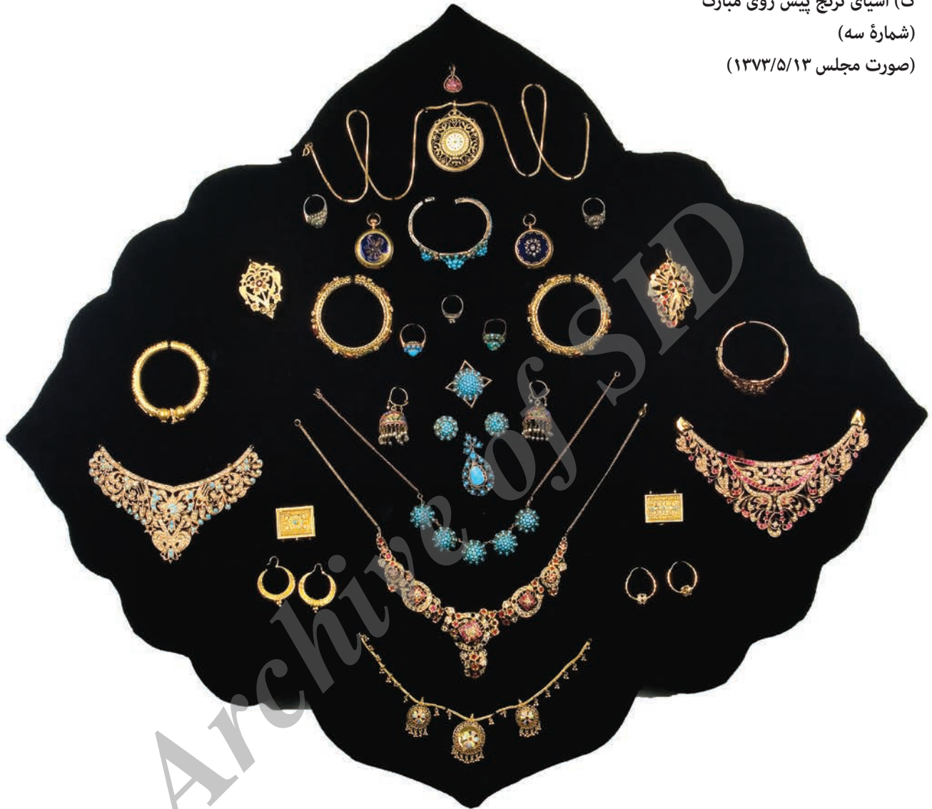
ک) اشیای ترنج پیش روی مبارک (شماره سه) (صورت مجلس ۱۳۷۳/۵/۱۳)