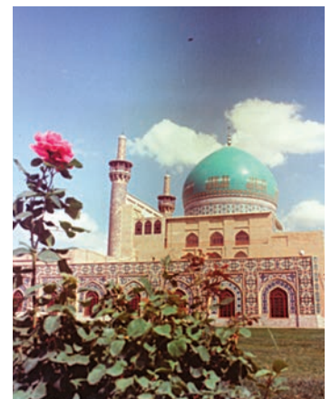
۱۹۲۵۱: نمای داخلی صحن آزادی (نو) در اوایل دوره پهلوی دوم تاریخ عکس: ۱۳۲۵

۳. خرید و مبادله: از این طریق عکس‌های مربوط به مجموعه‌داران اسناد تصویری که به مدیریت اسناد ارسال می‌شود با ذکر قیمت پیشنهادی فروشنده در فرم مخصوص ثبت شده، عکس‌های ارسالی توسط کارشناس اسناد تصویری با مجموعه‌های موجود در مدیریت اسناد مطابقت شده و با اطمینان خاطر از چاپ و یا عدم چاپ اسناد تصویری مربوطه در منابع مختلف تاریخی، گزارش حاصله به گروه کارشناسی خرید اسناد تصویری ارایه می‌شود و گروه کارشناسی با توجه به گزارش مربوطه و