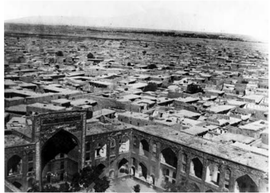
مدرسه میرزا جعفر و دورنمای شهر مقدس مشهد در دوره قاجار تاریخ عکس: ۱۲۸۳ق. شماره اموالی: ۷۷۵