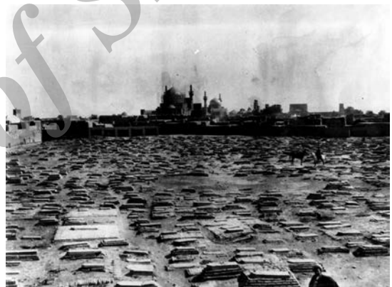
قبرستان عیدگاه واقع در جنوب حرم امام رضا (ع)، (محل فعلی صحن جامع رضوی) در دوره قاجار تاریخ عکس: ۱۳۰۹قمری، شماره اموالی: ۷۸۷۳