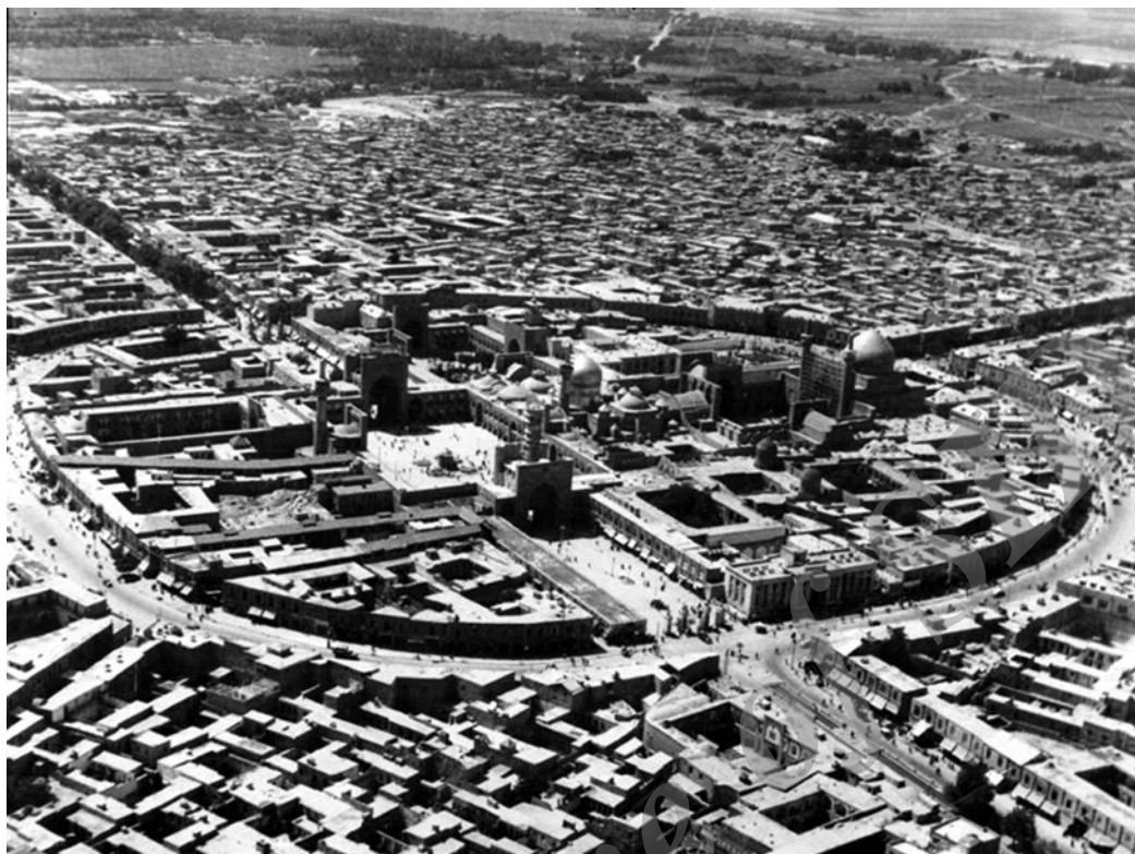
عنوان: بنای فلکه اول (خیابان فلکه) حرم امام رضا (ع) که در فاصله زمانی ۱۳۱۲-۱۳۰۸ شمسی بر گرداگرد حرم به فاصله ۳۰ متر از ساختمانهای اطراف ساخته شدو تا سال ۱۳۵۳ پابرجا بودو در این سال تخریب شد. تاریخ عکس: ۱۳۱۵ ، شماره اموالی: ۳۱۴۹۲