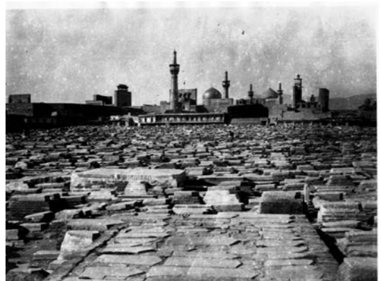
شکل قبرستان قتلگاه واقع در شمال حرم امام رضا (ع) در دوره قاجار تاریخ عکس: ۱۳۰۹ق. شماره اموالی: ۷۶۲۸