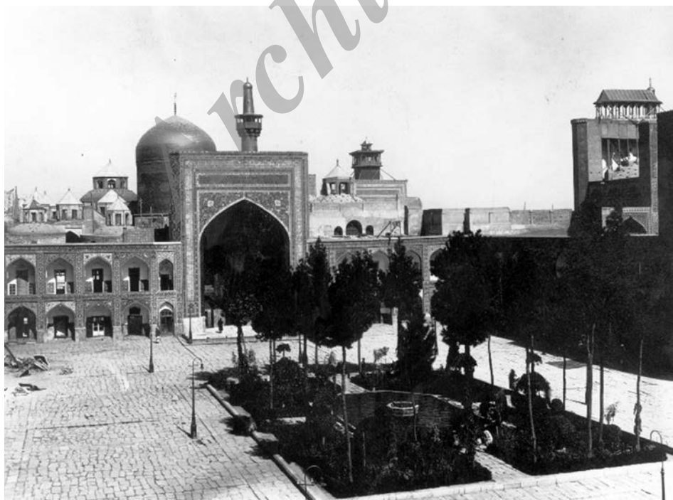
۱۹۲۵۱: فضای داخلی صحن آزادی (نو) در اوایل دوره پهلوی دوم تاریخ عکس: ۱۳۲۵، عکاس: سیاح

در اسناد آستان قدس رضوی به نام چند عکاس برمی‌خوریم که از این دستگاه حقوق دریافت می‌کردند و ظاهراً این امر از سال ۱۳۲۰ ق. به استناد وجود نام میرآقا عکاس‌باشی آستانه در اسناد این سال معمول بوده است. اما از سال ۱۳۲۶ ق. سندی وجود دارد که آشکارا نام این عکاس دیده