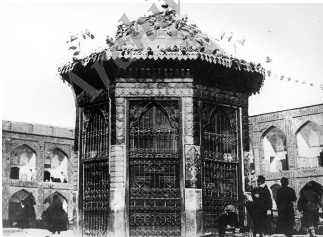
نمای سقاخانه اسماعیل طلائی در صحن عتیق (انقلاب فعلی) حرم مطهر امام رضا (ع) تاریخ عکس: دوره پهلوی اول، شماره اموالی: ۶۲۰