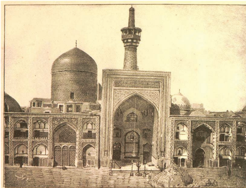
ایوان طبلای صحن قدیم