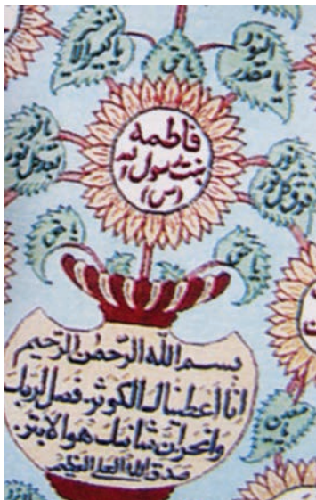
تصویر ۲ سبوی مزین به سوره ی کوثر و نام حضرت فاطمه زهرا همراه با یا مقدرالنور، یا نور بعد کل نور، یا نور فوق کل نور

در این تصویر نام فاطمه زهرا آغاز حرکت درخت است