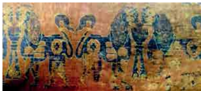
تصویر ۴ لومان، کلیسای نوتردام دولاکتور - یافته ایرانی، شیران متقابل در برابر آتشدان سده ۸-۱۰ م. (گریشمن، تصویر ۴۱۹)

بزرگ اساطیری نیز وجود دارد: فرنیخ (آتش موبدان) در فارس، گشنسب (آتش ارتشتاران) در آذربایجان و برزین مهر (آتش کشاورزان) در خراسان است. این سه آتش به دست جمشید و کیخسرو و گشتاسب تأسیس شدند. در دین کنونی زرتشت، آتش چنان مقدس است که نه نور خورشید باید بر او بیفتد و نه چشم کافری او را ببیند. دلیل قداست آتش جریان طولانی و دشوار تطهیر آن است. از امشاسپندان، اردیبهشت حافظ آتش است (قلی زاده، ۱۳۸۷، ۲۷-۳۰).