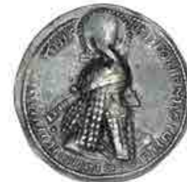
تصویر ۱ الف