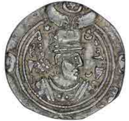
تصویر ۷ نماد بال بر تاج شاهی ساسانی که ماه و ستاره را در میان گرفته است. (مجموعه موزة ملک)