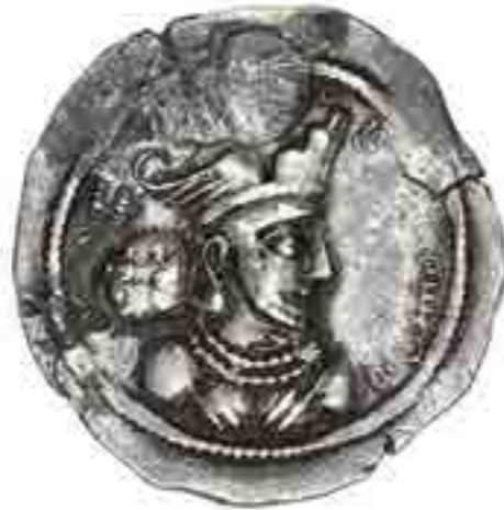
تصویر ۹ نماد کوه، بال و گوی بر تاج شاه ساسانی (مجموعه موزة ملک)

گوی سلطنتی چون دایره‌ای یا کروی است مظهر ابدیت، خود شمولی، سلطه جهانی، تسلط بر زمین، نیرو و مقام امپراطوری است. گوی سلطنتی در معنی کمال با نماد کره مشابه است. گوی مظهر تسلط خدا یا منجی تا نقاط دور است. گوی سلطنتی بر فراز ستون مظهر آسمان، مرز یا حدود است (کوپر، ۱۳۸۶، ۳۱۸). کره مظهر کمال، تمامیت همه امکانات در جهان محدود، شکل آغازینی که کلیه اشکال دیگر را در بر می‌گرفت، از بین برنده زمان و مکان، ابدیت، طاق آسمان، جهان، جان و جان عالم است. جنبش مدور تجدید حیات و چرخش آسمان‌ها در نمادهای اسلامی کره، روح و نور آغازین است (کوپر، ۱۳۸۶، ۲۹۰).