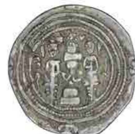
تصویر ۵ نماد آتش و نگهبانانش بر سگه‌های ساسانی موزه ملک