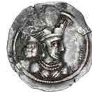
تصویر ۳: درهم نقره ای بهرام چهارم ساسانی، ۲۹۹-۲۸۸ م. (موزه ملک، شماره اموال ۱۰۲۰ و ۰۶ و ۰۰۰۰)

یکی از اصلی‌ترین نمادهای سگه‌های ساسانی، آتش است. آتش با مفهوم نمادین استتعاله، تطهیر، نیروی