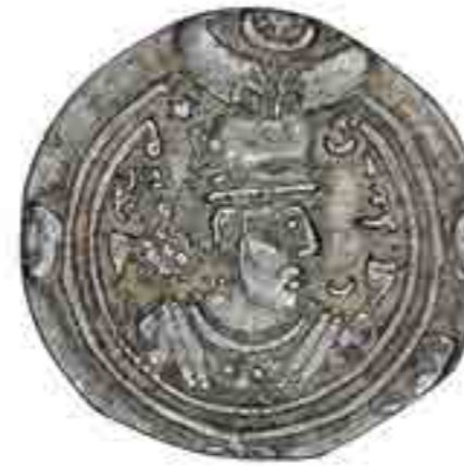
تصویر ۸ نماد چهار ماه همراه با ستاره بر سگه‌دوره ساسانی (مجموعه موزة ملک)

بنا به روایت مینوی خرد، ماه و خورشید اساساً برای روشن سازی جهان و رشد دادن به همه زاییدنی‌ها و رویدنی‌ها و در دست داشتن روز و ماه و سال و تابستان و زمستان و بهار و پاییز و... است (قلی زاده، ۱۳۸۸، ۳۷۶) در سگه‌های ساسانی چهار ماه چهار سوی سگه دیده می‌شود