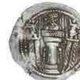
تصویر ۲: سگه شاپور اول ساسانی نقره، ۲۴۱-۲۷۲ م (موزه ملک، شماره اموال: ۰۰۰۴ و ۰۰۰۶ و ۰۰۰۰)

شاپور اول با افزودن دو نگهبان آتش در دو طرف آتشدانی که در سگه‌های پدر او نیز بود، نوعی جدید از نقش پشت سگه‌ها را پدید آورد که تا پایان دوره ساسانی استمرار یافت. (تصویر ۲) در روی سگه، شاه تاجی کنگره دار با گوش‌بند و گوی بزرگ بالای آن، بر سر دارد که مشخصاً لازمه تاج‌های شاهی ساسانی است. ریش او از حلقه‌ای رد شده و مجعد است. در سگه‌های هرمزد اول (۲۷۲-۲۷۳ م.) خود شاه به همراه موبد در برابر آتش مقدس حضور دارد. نقش بهرام اول شباهت زیادی به سگه‌های اردشیر اول دارد ولی تاج او نوک‌های تیز دارد. سگه‌های بهرام دوم مشخصاً ویژه دارد و آن استفاده از تاج بال‌دار همچون نقش برجسته صخره‌ای نقش رستم است. نوع سگه‌های شاه با شهبانو و پسر، از دیگر انواع سگه‌های بهرام دوم است. کلاه شهبانو و پسر مزین به سر جانورانی چون گراز، شیر و عقاب است. (تصویر ۱ ب) نرسی که همچون هرمزد اول در پشت سگه‌هایش در کنار آتشدان حاضر است، تاجی با برگ‌های نخل بر سر دارد. تاج هرمزد دوم به شکل عقابی است که از منقارش مروارید می‌ریزد. در دوران حکومت شاپور سوم، قرار دادن نیم‌تنه طلایی هرمزد بخ در میان شعله‌های آتشدان از زمان هرمزد اول رایج گردید. (تصویر ۳) بهرام چهارم تاجی بال‌دار و کنگره‌دار بر سر دارد. سگه‌های آخرین اعضای خانواده ساسانی، تقلیدی کامل از سگه‌های خسرو دوم است که برخی از آنها دارای همان تاج و ستاره و هلال ماه در حاشیه‌اند (پوپ، ۱۳۸۷، ۱۰۱۷).