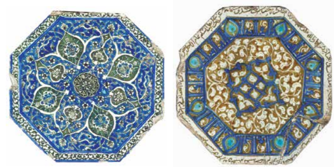
طرح واژه ۱. تجزیه و تحلیل نشانه‌های تصویری کاشی براساس رابطه دال و مدلول

تحلیل یافته‌ها و اطلاعات در این تحقیق، در چهار جدول تنظیم و دسته‌بندی شده است. بدین صورت که جداول شماره ۱ و ۲، رابطه دال و مدلول و معنای نشانه‌های تصویری در آثار را بیان می‌کند. در هر اثر، دلالت‌های معنایی مشترک و متعدد میان یک دوره تاریخی و دوره‌ای دیگر است. در تحلیل معنای نشانه‌های تصویری سعی شده است مفاهیم محسوس در کاشی‌کاری دوره اسلامی بیان شود. به دلیل وجه اشتراک و شباهت در کاشی‌های هشت ضلعی و هشت پر، از تکرار برخی از نشانه‌های تصویری در جدول شماره ۲، خودداری شده است. در جدول شماره ۳، نشانه‌های تصویری براساس نظریه پیرس در دسته‌بندی انواع نشانه‌ها، تبیین شده است. موضوع یا اثر تصویری، نوع نشانه و مورد تأویلی، متغیرهای بررسی شده در این قسمت هستند. علاوه بر این، تعداد نشانه‌ها در هر یک از گروه شمایی و نمادین، با در نظر داشتن نوع کاشی‌ها در نموداری جداگانه در همین بخش بررسی می‌شوند. در جدول شماره ۴، به تجزیه و تحلیل ساختار کاشی‌های ازاره پرداخته شده است که شامل چهار نمونه کاشی با ساختار هندسی هشت ضلعی و چهار نمونه با ساختار هندسی ستاره هشت پر است. به دلیل قدمت طولانی نمونه کاشی‌ها و واضح نبودن تمام جزئیات نقوش، اجرایی جداگانه از روی نمونه‌ها انجام شد تا بررسی تصاویر و معنای استنباط شده از آنها واضح و دقیق باشد.