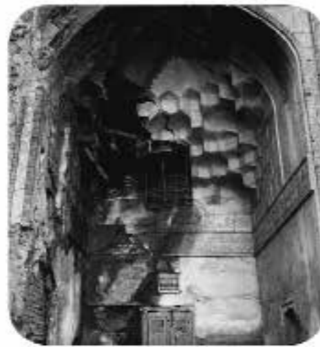
نمایی از مدرسه بالاسر، شماره دستیابی: ۸۴۳۸، رنگی، قطع: ۲۰×۲۵، تعداد قطعه: ۱، محل: مشهد.