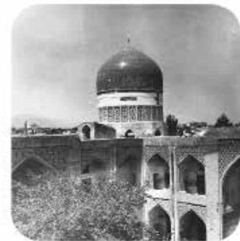
نمایی از گنبد و ایوان و غرفه‌های مدرسه دو در، شماره دستیابی: ۲۹۶، رنگ: سیاه و سفید، قطع: ۳۰×۴۰، تعداد قطعه: ۱، عکاس: محمّدصانع، محل: مشهد.