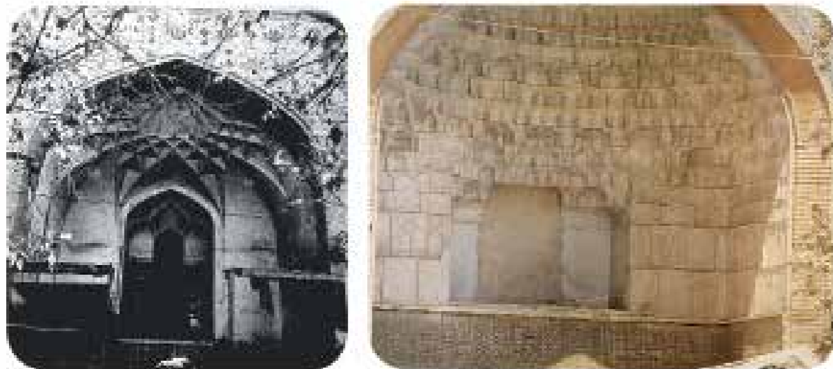
مدرسه باقریه، شماره دستیابی: ۵۶۸۱، رنگی، قطع: ۲۵×۲۰، تعداد قطعه: ۱، عکاس: ؟، محل: مشهد. نمایی از مدرسه بالاسر، شماره دستیابی: ۸۴۲۸، رنگی، قطع: ۲۰×۲۵، تعداد قطعه: ۱، عکاس: ناصری، محل: مشهد.