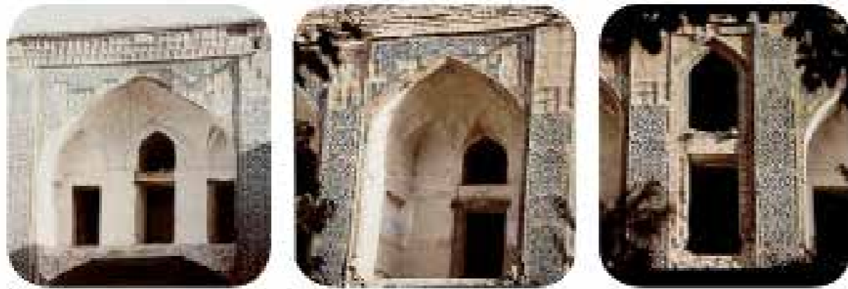
تصاویری از مدرسه میرزا جعفر (واقع در گوشه شرقی صحن انقلاب قدیم) قبل از بازسازی، رنگی، قطع: ۲۴×۱۹، تعداد قطعه: ۱، عکاس: ؟، محل: مشهد، نوع: اصلی، تاریخ انتشار: ۱۳۴۳.