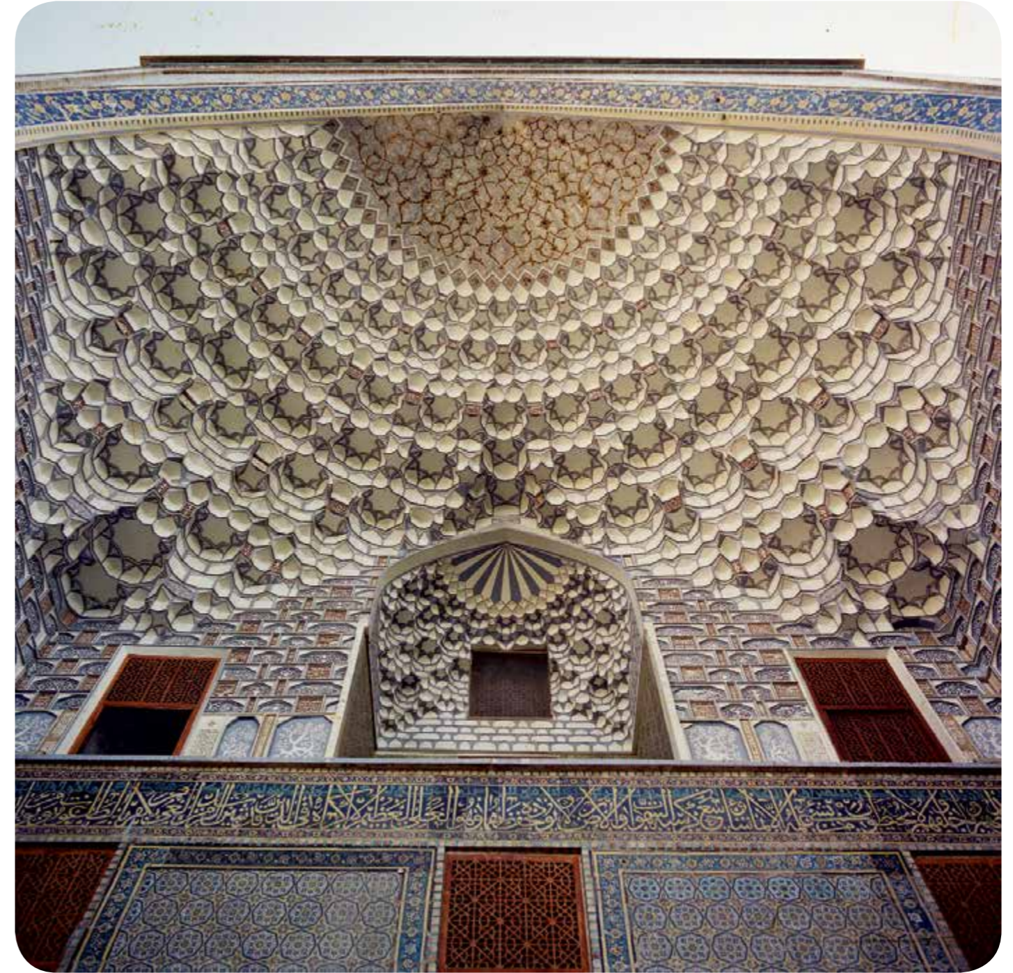
مقرنس کاری ایوان های مدرسه میرزا جعفر (دانشگاه علوم اسلامی رضوی)