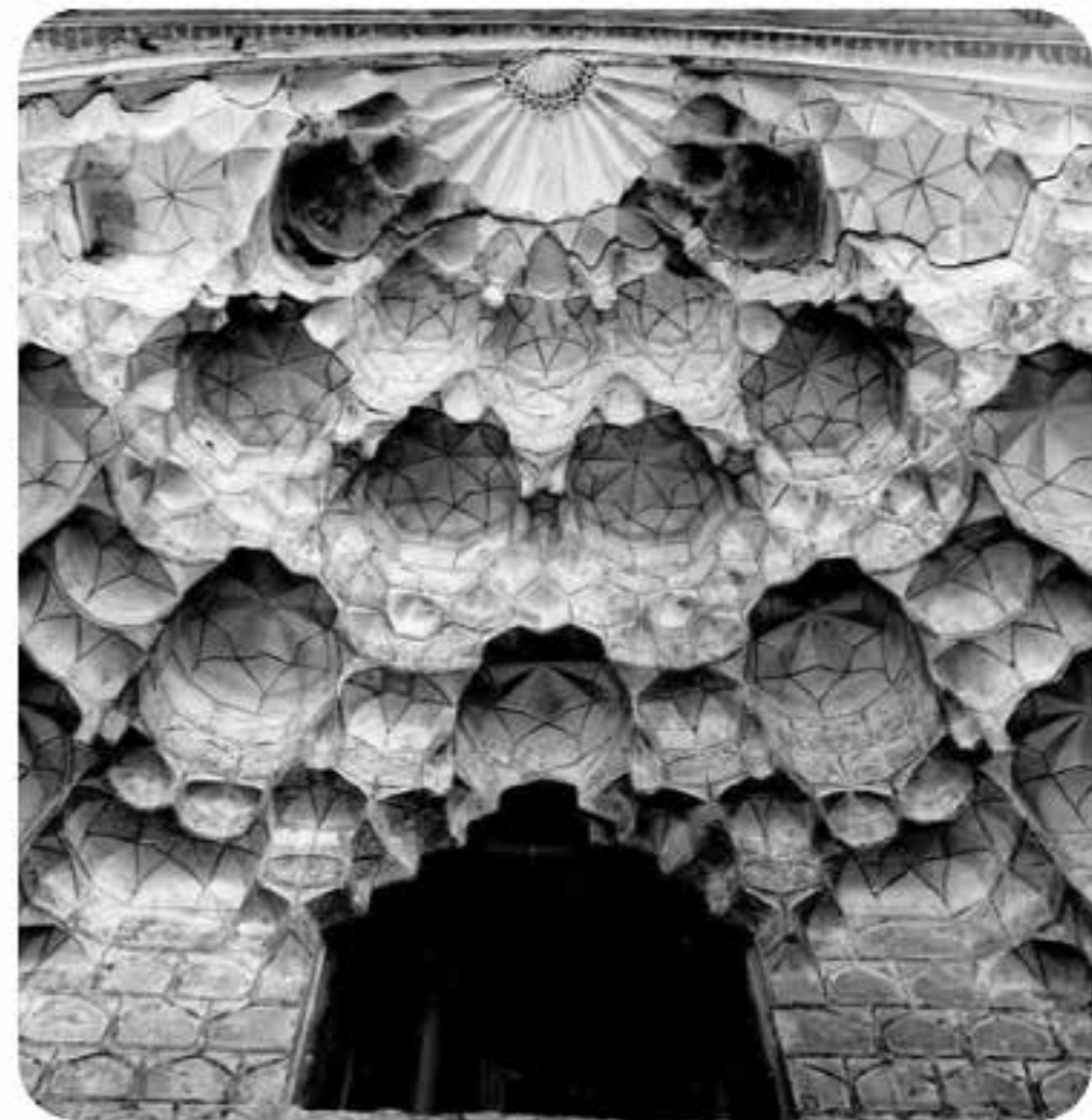
تزیینات هنری زیر سرطاق مدرسه خیرات‌خان، شماره دستیابی: ۱۲۲۹۴، رنگ: سیاه و سفید، قطع: ۲۵×۲۰، تعداد قطعه: ۱.