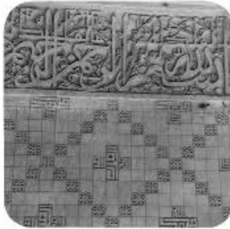
کتیبه مدرسه بالاسر، شماره دستیابی: ۵۵۸۹، رنگی، قطع: ۵/۱۲×۵/۱۲، تعداد قطعه: ۱، محل: مشهد.