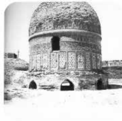
نمایی از گنبد مدرسه دو در قبل از نوسازی و بازسازی، شماره دستیابی: ۲۵۷۲۰، رنگ: سیاه و سفید، قطع: ۹×۱۲، تعداد قطعه: ۱، نوع: عکس، تاریخ عکس: ۱۳۵۰.