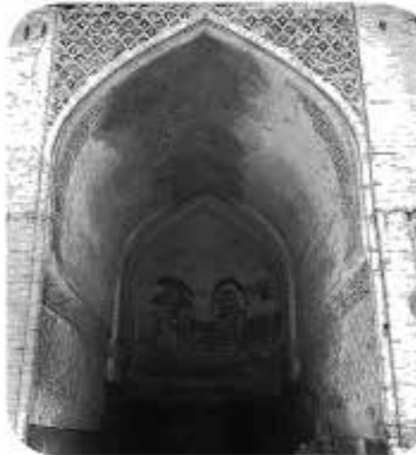
ایوان مدرسه بالاسر، شماره دستیابی: ۸۴۸۹، رنگی، قطع: ۲۰×۲۵، تعداد قطعه: ۱، محل: مشهد.