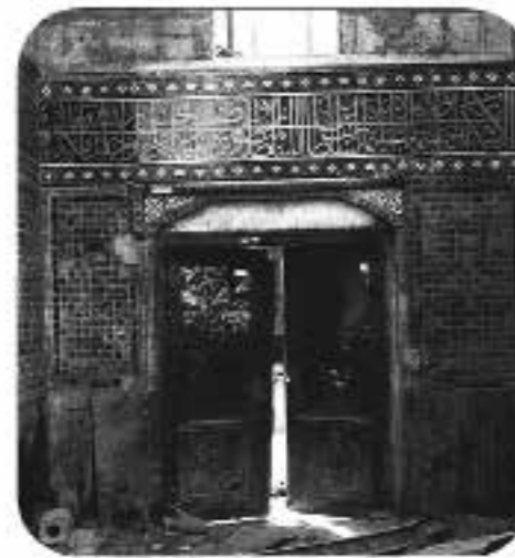
نمایی از درب و قسمتی از دیوار مدرسه پریزاد، شماره دستیابی: ۱۸۰، رنگ: سیاه و سفید، قطع: ۳۰×۴۰، تعداد قطعه: ۱، محل: مشهد، نوع: اصلی، تاریخ انتشار: خرداد۱۳۵۷.