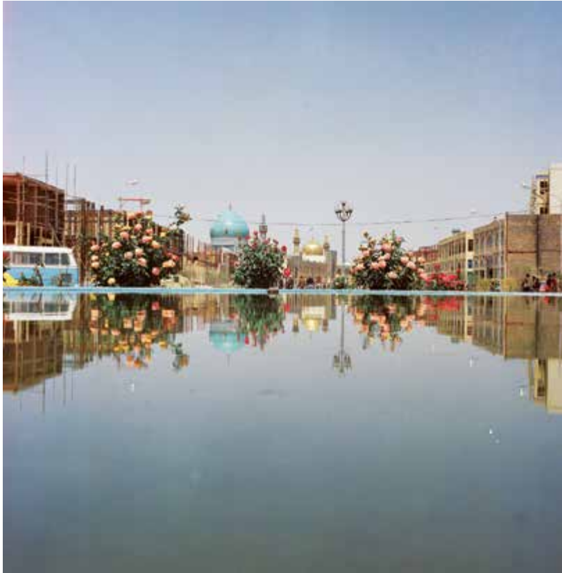
نمای حرم از فلکه آب (میدان بیت المقدس)، ۱۳۵۴