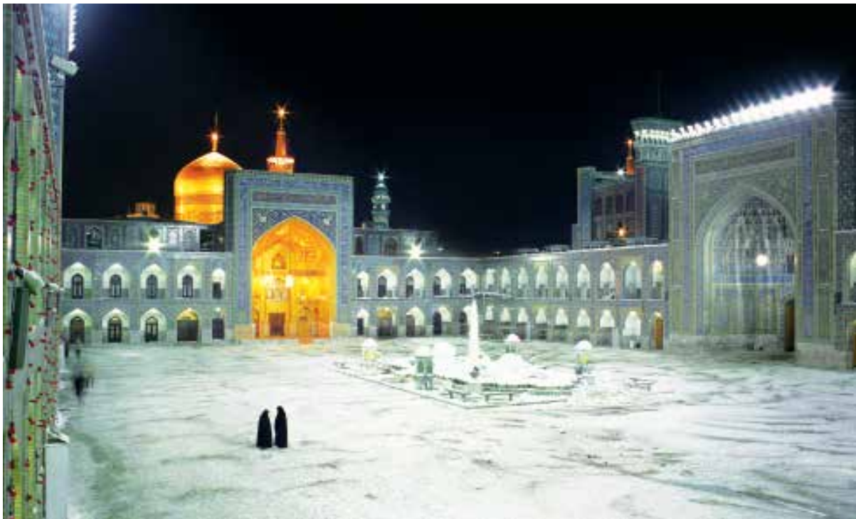
زمستان ۱۳۷۹، صحن آزادی، عکاس: حسن توکلی