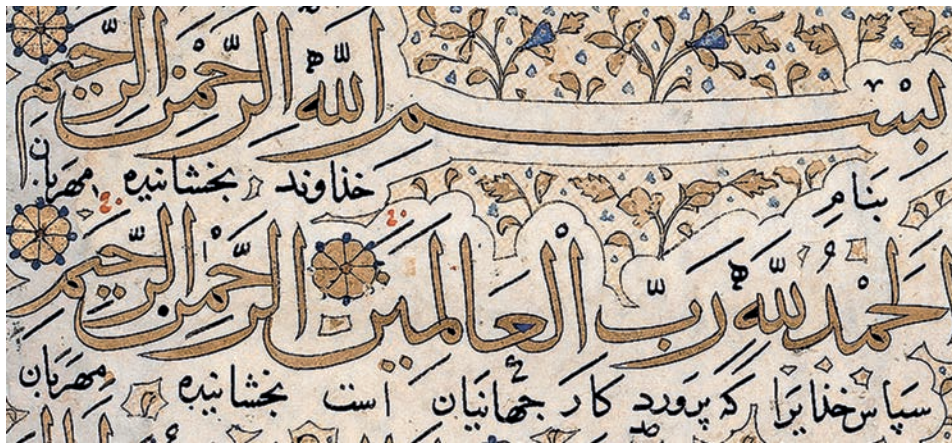
تصویر ۱۲. سطری از قرآن زین العابدین شیرازی، کاسه دوایر در آن گردتر و به قلم ثلث شباهت دارد.