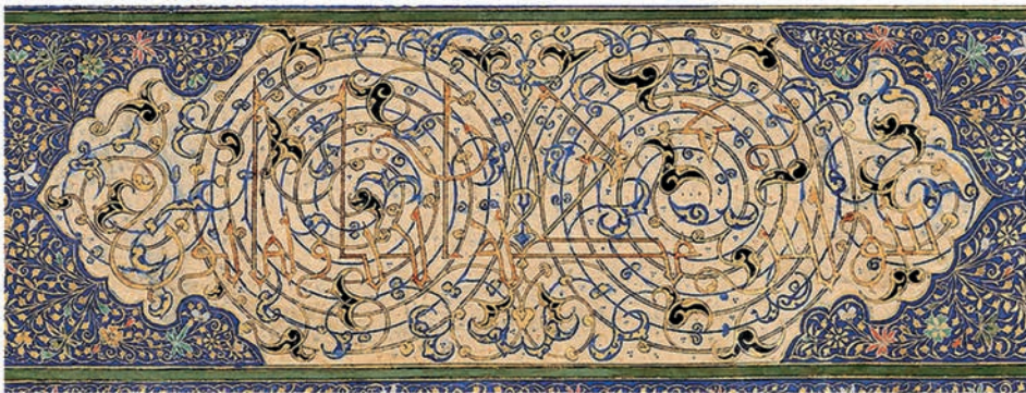
تصویر ۸. بخشی از سرسوره یس، از جزوه وقفی ابراهیم سلطان بر حرم امام رضا(ع)، شیوه تذهیب زمینه این اثر به تذهیب سرسوره‌های قرآن بایسنجری شبیه است.