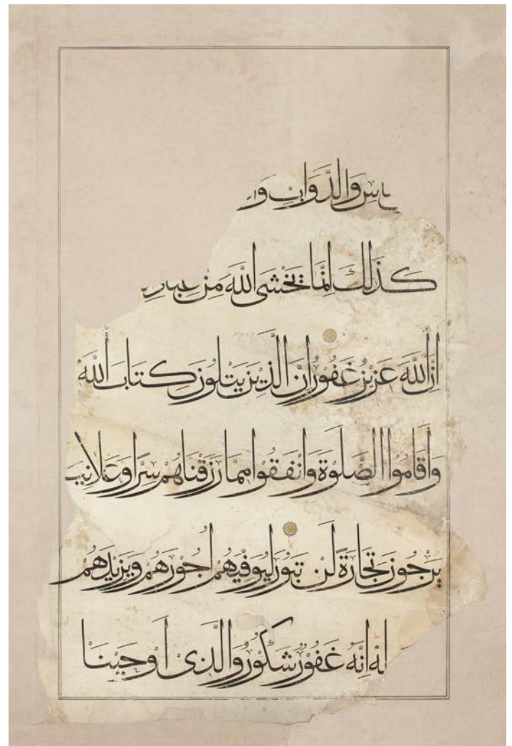
تصویر ۱۰. صفحه‌ای از قرآن بایسنغری که در آن انتهای حروفی چون «و»، «ر» به پایین گرایش دارد.