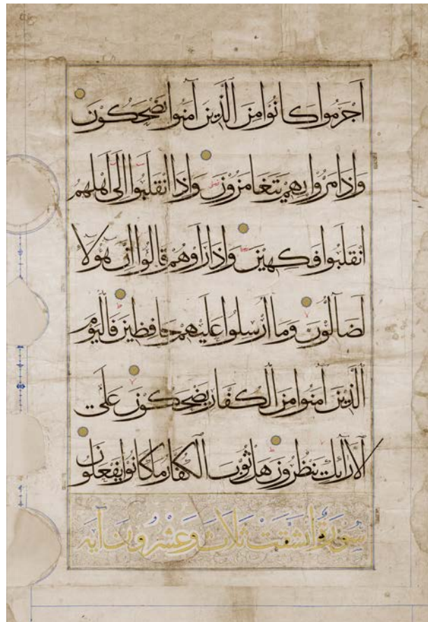
تصویر ۱. برگی از قرآن بایسنخری در بردارنده آیات پایانی سوره مطفین و سرسوره انشقت (الانشقاق) که بخشی از حاشیه‌اش سالم مانده و بر مبنای آن عرض تقریبی قرآن قابل محاسبه است.

که در منابع مختلف از جمله راهنمای گنجینه قرآن ثبت شده، اندازه کنونی برگ‌هاست که حاشیه ندارد و فقط اندکی از جدول بزرگتر است. اندازه جدول صفحات سالم با اختلافی اندک حدود ۱۵۷×۹۵ س.م است. فاصله لبه کاغذ تا جدول یکی از برگ‌ها که بخشی از حاشیه بزرگش تقریباً سالم است، با افزودن اندازه بخش ناقص نشان عشر و حاشیه احتمالی حدود سی سانتی‌متر و فاصله لبه حاشیه کوچک (طرف عطف) حدود نوزده سانتی‌متر است. (تصویر ۱) بنابراین عرض تقریبی این