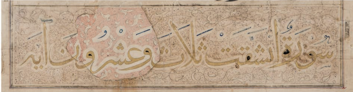
تصویر ۷. سرسوره انشققت (الانشقاق) به قلم ثلث زرین محرز، اکثر سرسوره‌های این قرآن ویژگی‌هایی مشابه این نمونه دارند.