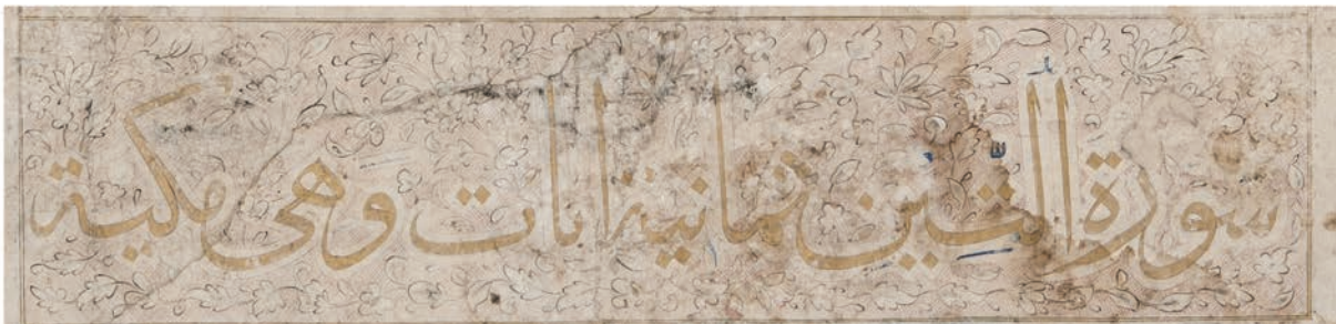
تصویر ۹. سرسوره التین به قلم ثلث زرین محرز و تزیینات ختایی در زمینه، کتیبه این سوره و دو سوره دیگر برخلاف دیگر سرسوره‌ها با نقوش ختایی درشت تزیین شده است.

کتابت‌شان بسیار به هم نزدیک است. برای نمونه در تصویر ۱۰ حرکت انتهای «و» و «ر» به سمت پایین گرایش دارد و از این بابت به شیوه خطاطان غرب ایران بسیار نزدیک است اما در صفحات دیگر مانند تصویر ۱۱ حرکت انتهای این حروف در جهت افقی است. به‌طورکلی شیوه خط نسخه منطبق با سبک خراسانی سده نهم است. این سبک چند ویژگی مهم دارد: ارتفاع حروف عمودی غالباً بلند است و بارزترین ویژگی این سبک به شمار می‌رود. این ویژگی سبب می‌شود خط استوار و بلندقامت به نظر برسد و از قدیم در کتابت قلم کوفی این منطقه هم وجود داشته است که مثال بارز آن نسخه عثمان بن حسین و راق غزنوی محفوظ در کتابخانه و گنجینه قرآن آستان قدس رضوی است. ۸ صفت برجسته و بارز دیگر سبک خراسانی قلم محقق