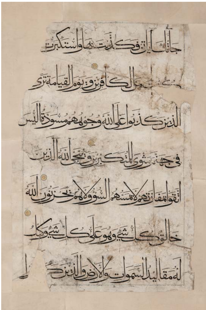
تصویر ۱۱. صفحه ای از قرآن بایسنغری با خصوصیات نسبتاً متفاوت، در این صفحه انتهای حروف بیشتر در جهت افقی کشیده شده است.

مسطح بودن کاسه حروف مدور آن است. در این سبک کاسه حروفی چون «ی»، «ن»، «س» و... غالباً با انحنایی بسیار کم کتابت می‌شود، این صفت وقتی با خاصیت استواری و ارتفاع زیاد حروف عمودی همراه باشد سبب می‌شود در نظر کلی خط نسخه خطی مسطح و متکی به حرکت‌های عمودی و افقی باشد. این ویژگی را وقتی با سبک کتابت مناطق دیگر مقایسه کنیم به‌روشنی درمی‌یابیم. برای نمونه در خط زین‌العابدین شیرازی، خطاط سده نهم، کاسه دوایر گردتر و به دوایر قلم ثلث شبیه است. (تصویر ۱۲)