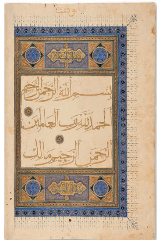
تصویر ۵. صفحه‌ای از جزوه شماره ۴۱۶، وقفی شیخ سوداگر، کتابخانه مرکزی آستان قدس رضوی.