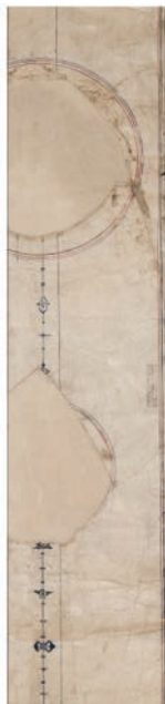
تصویر ۶. قلم‌گیری دور و شرفه نشان‌های عشر و خمس قرآن بایسنغری که درونشان را بریده‌اند.

گفتنی است سرسوره‌های البروج، الحاقه، البلد و اللیل بدون تذهیب و تحریر رها شده و تذهیب سرسوره‌های الشرح، التین و العلق با نقوش ختایی طراحی شده است که از این نظر شباهت چشمگیری به تذهیب سرسوره «الناس» در قرآن ابراهیم سلطان دارد. (تصویر ۹) ناهماهنگی طرح تذهیب سرسوره‌های پایانی به‌خصوص استفاده از نقوش ختایی درشت که به زمان کمتری در اجرا