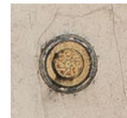
تصویر ۴. نشان ختم آیات در قرآن بایسنغری با نقش ستاره شش‌پر

از صفحات اولیه نسخه، صفحه وقف‌نامه یا تقدیم و به‌خصوص صفحه افتتاح، برگه به‌جا مانده که بشود ساختار سرلوح و کمند را بازشناخت. نسخه جدولی ساده دارد که با رنگ لاجوردی و طلایی طراحی شده است. تذهیب نیز ساده و مختصر است، به‌خصوص در رنگ‌پردازی. سادگی و اختصار رنگ‌پردازی در تذهیب با سادگی و صلابت قلم محقق متن هماهنگی خاصی دارد. نشان فصل آیات، شمس‌های زرین کوچکی است که با نقش گره ساخته شده است. تا سده هشتم هجری غالباً درون نشان ختم آیات، شماره آیه را با حروف ابجد می‌نوشتند اما در این اثر چنین نیست. مشابه این نشان را در نسخه‌های بسیار دیگری می‌توان یافت (تصویر ۴) از جمله جزوه شماره ۴۱۶ و ۴۱۷ کتابخانه مرکزی آستان قدس رضوی وقفی شیخ سوداگر که آن نیز در ابعاد