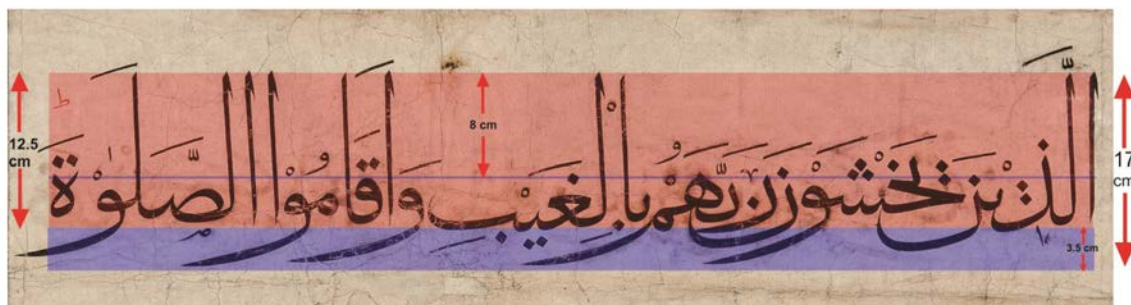
تصویر ۳. فواصل کرسی‌ها در سطور قرآن بایسنخری