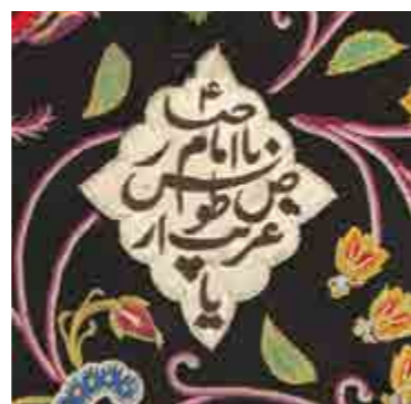
تصویر ۳. کتیبه طرفین نقش سرو