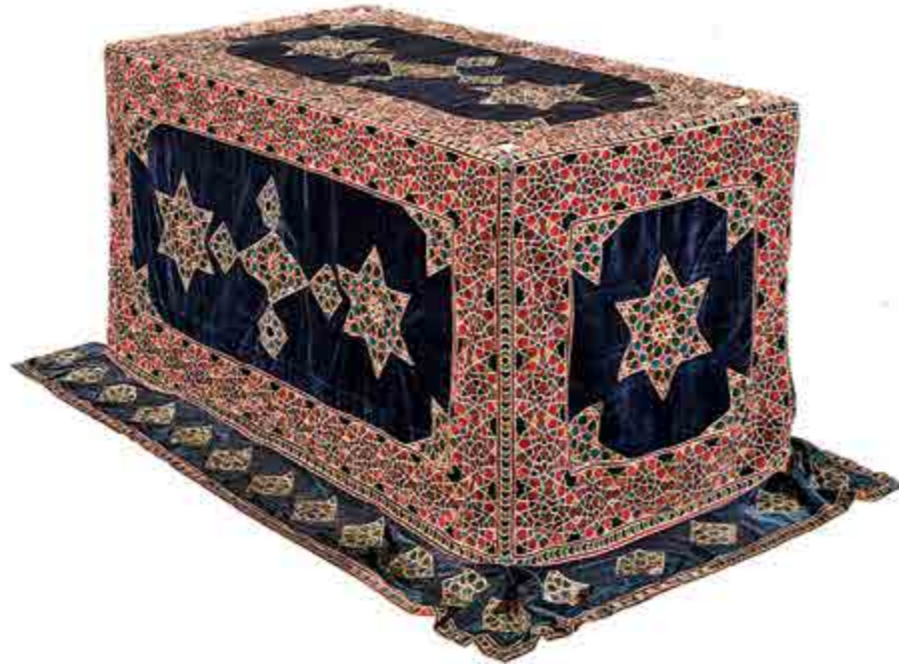
تصویر ۷. نمایی از صندوق پوش لندره دوزی مشابه صندوق پوش مخمل لندره دوزی مذکور (تصویر از کتاب «شاهکارهای هنری آستان قدس» برای تداعی صندوق پوش انتخاب شده است).