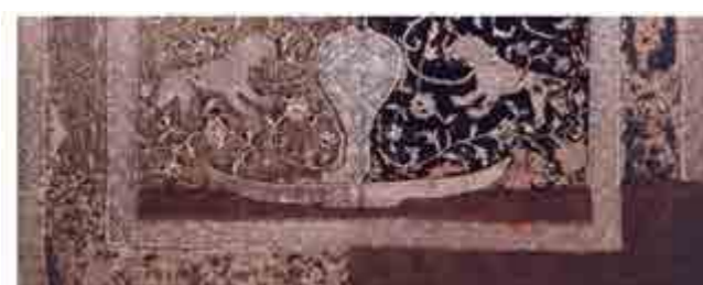
تصویر ۱۳. کتیبه واقف و نقوش پرده