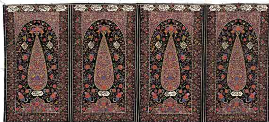
تصویر ۱. نمای کلی از قطعه چهارقابی دوره‌پوش

ز غلغله چون نوبت خروش / از انبیا به حضرت روح‌الامین