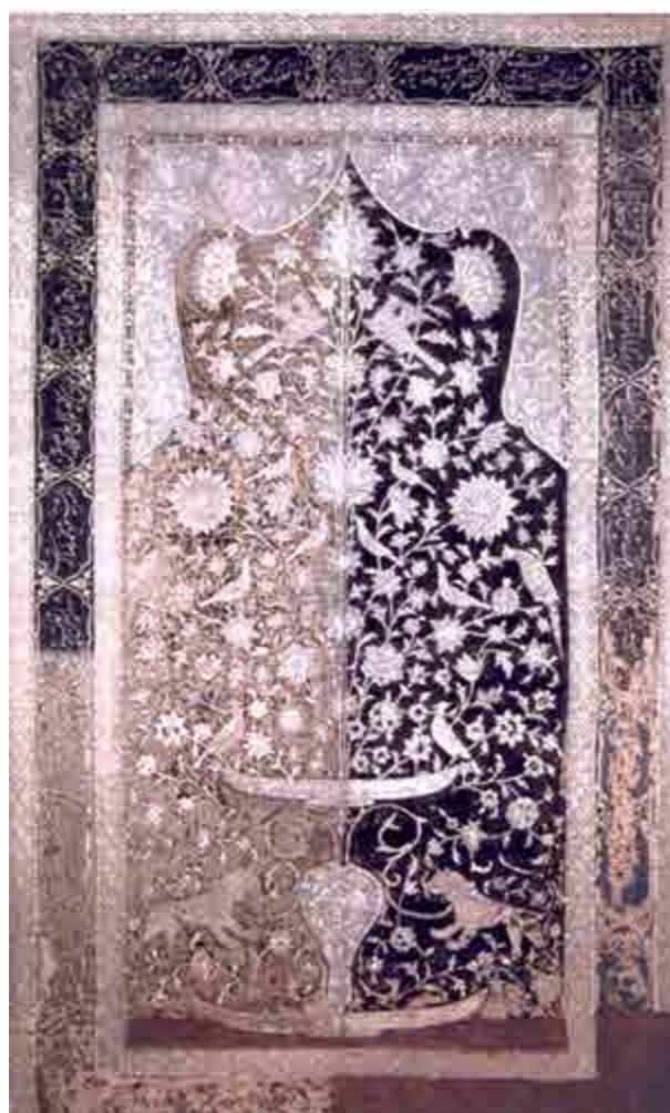
تصویر ۱۲. نمایی کلی از پرده گلابتون‌دوزی شده