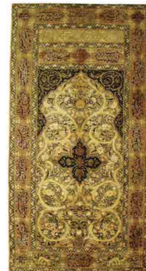
تصویر ۹. پرده قلاب‌دوزی ابریشمی، برگرفته از دایره‌المعارف آستان قدس، ج ۱.