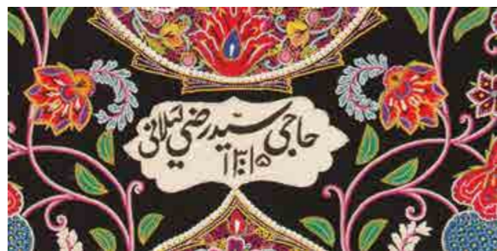
تصویر ۴. کتیبه نام واقف دوره‌پوش