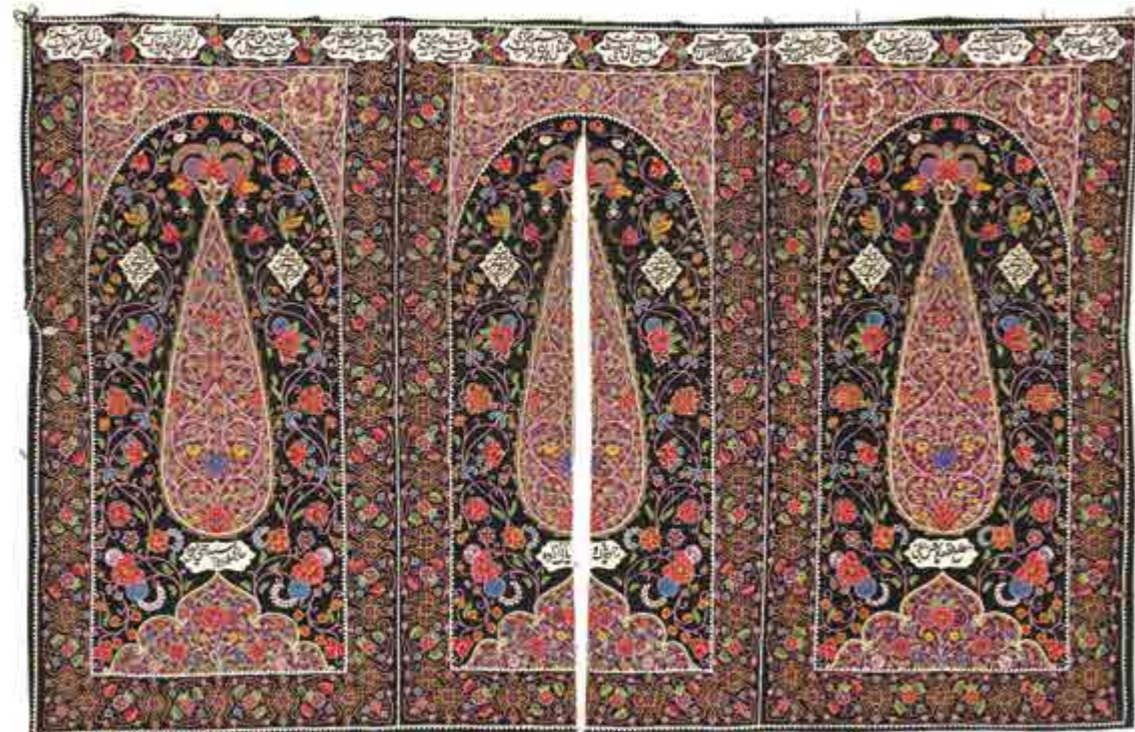
تصویر ۲. نمایی از قطعه کوچک دوره‌پوش