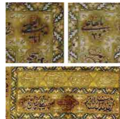
تصویر ۱۱. کتیبه بالای محراب

نقش پرده محرابی است که گلدانی در مرکز آن قرار دارد. درون متن پرده با گل‌های فراوان تزیین شده و دو شیر در پایین آن و دوازده پرنده بر روی گل‌ها دیده می‌شود. (تصویر ۱۲)