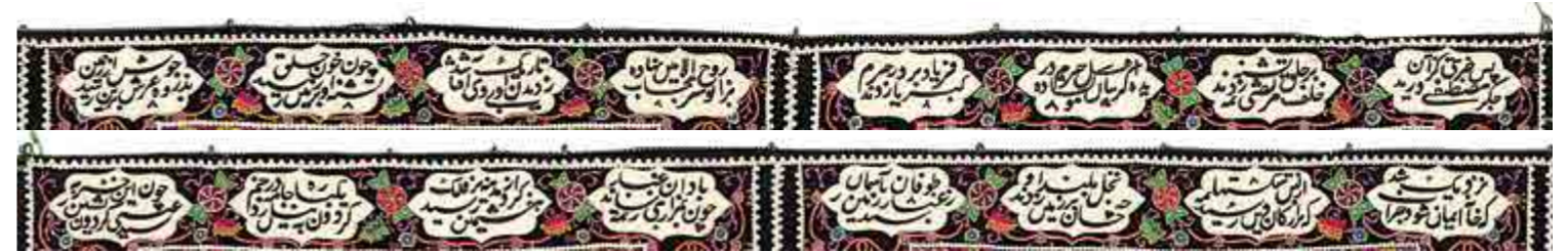
تصویر ۵. کتیبه‌های حاوی اشعاری از محتشم کاشانی و عبدالله خوافی