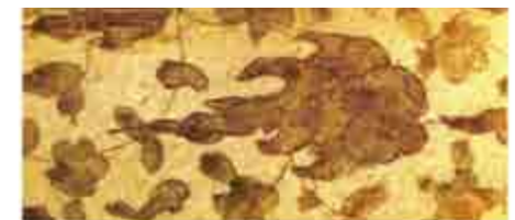
نقش تشعیر، قرآن شماره ۲۱۵

این تزیینات شامل نقوش تذهیب به‌کاررفته در اوراق ابتدا و افتتاحیه مصاحف است که از مهم‌ترین نقوش و آرایه‌های مصاحف مکتب هرات به‌شمار می‌رود. از نظر کاربردی و ظاهری می‌توان تزیینات را در سه شکل برگ ظهریه، سرلوح و لوح مذهب فاتحه‌الکتاب تقسیم‌بندی نمود. ۲ نقوش تذهیب به‌کاررفته در این سه شکل شامل انواع اسلیمی، ختایی، کتیبه‌نویسی، دندان‌موشی، حاشیه، شرفه، گره‌بندی، تشعیرسازی، کمند و جدول است و عمدتاً رنگ‌های اصلی لاجوردی و زر در آنها به‌کار رفته است. نقش تشعیر، تنها در حاشیه اوراق ابتدایی قرآن به شماره ۲۱۵ مشاهده می‌گردد، طرح آن شامل نقوش گل و بوته و ابری است که با هنر تشعیرسازی قدیمی‌ترین نسخه‌های خطی شناسایی‌شده، قابل مقایسه است. ۳