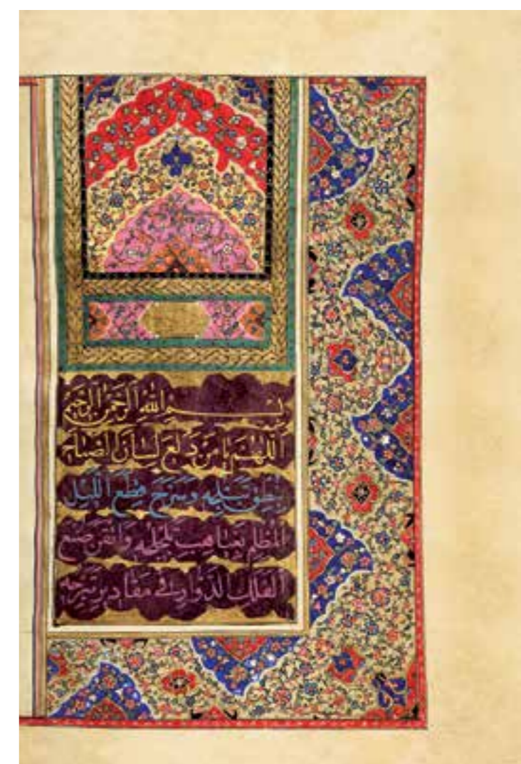
تصویر ۱، نمونه تذهیب و ترصیع کتاب دعای صباح، مأخذ: مؤسسه آفرینش‌های هنری آستان قدس رضوی