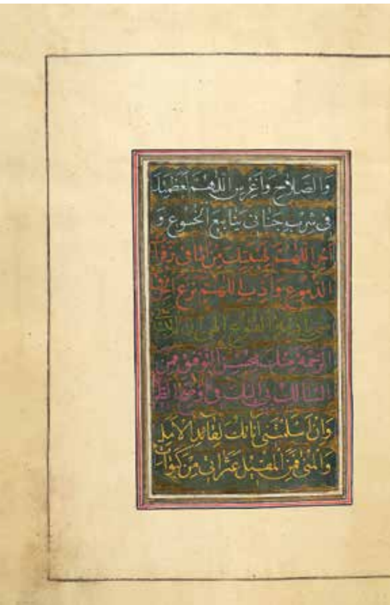
تصویر ۴، نمونه رنگ‌نویسی کتاب دعای صباح