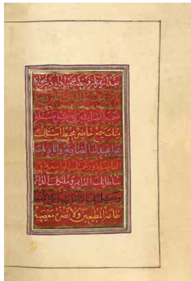
تصویر ۲، نمونه صفحات کتاب دعای صباح