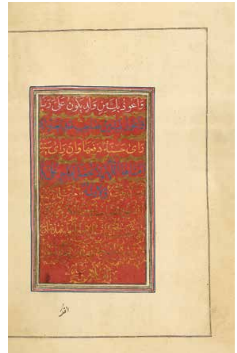
تصویر ۳، صفحه پایانی و ترقیمه کتاب دعای صباح، مأخذ: مؤسسه آفرینش‌های هنری آستان قدس رضوی

یکی از مشخصه‌های بارز این بانوی هنرمند، مهارت بسیار وی در رنگ‌نویسی است. نوشتن خط نسخ با مرکب‌های الوان مانند سفیداب، سیلُو، شنگرف، زر و سیم محلول و آب‌زعفران از دیرباز معمول بوده اما همیشه رنگ‌نویسی در قلمرو خوشنویسی کاری دشوار بوده است؛ زیرا نوشتن با محلول زر، نقره، لاجورد، سیلو و زنگار، به سبب وجود براده‌های فلزی و معدنی در آنها که بر شق و قَط قلم‌نی تأثیر می‌گذاشته، از عهده همه خوشنویسان برمی‌آمده است. دلیل اینکه رنگ‌نویسی، تنها به چند سطر از نسخه‌های قرآنی یا قطعه‌ها و رُقع‌های دو تا چهار سطر