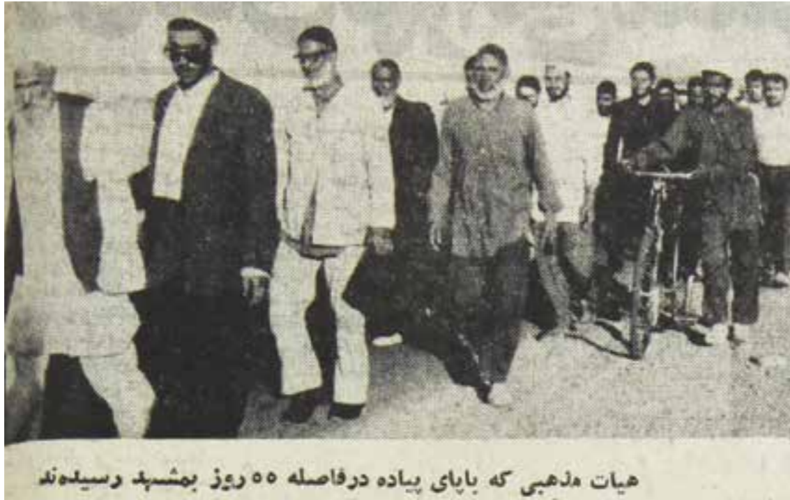
هیات مذهبی که با پای پیاده در فاصله ۵۰ روزه بمشهد رسیدند