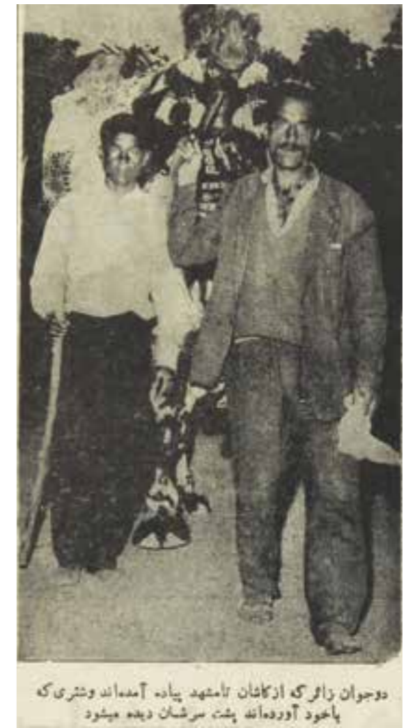
دو جوان زائر که از کاشان تا مشهد پیاده آمده اند و شتری که با خود آورده اند، پشت سرشان دیده میشود

عکس تشریف زیارت هیئت پنجاه نفری از تهران که با پای پیاده مسیر طولانی تهران تا مشهد را طی نمودند، سومین تصویر تشریف زائران پیاده و نخستین عکس تشریف گروهی زائران پیاده حرم مطهر امام رضاع (ع) است که در مطبوعات درج شده است: یک هیئت پنجاه نفری که پای پیاده جهت زیارت آستان مقدس حضرت ثامن الحجج (ع) از تهران حرکت نموده بود، پس از ۵۴ روز پیاده روی به مشهد وارد شد و مورد استقبال جمع کثیری از اهالی مشهد و هیئت های مذهبی قرار گرفت. «البته عده زیادی از مردم مشهد که از ورود هیئت دبروز مطلع شده بودند، روز قبل نیز تا چند کیلومتری خارج شهر به استقبال گروه مذهبی رفتند و به آنها خیر مقدم گفتند.» ۳ اعضای هیئت بلافاصله پس از ورود به مشهد جهت زیارت به حرم مطهر مشرف شدند. سپس در حسینیه پزندگان واقع در میدان دقیقی اقامت کردند. سرپرستی این هیئت را حجت الاسلام حاج شیخ جواد خراسانی، امام جماعت مسجد ولی عصر (ع) خیابان سرآسیاب دولاب به عهده دارد. حجت الاسلام حاج شیخ جواد خراسانی که خود خراسانی الاصل است درباره چگونگی این سفر به خبرنگار ما اظهار داشت: «این دومین سفری است که ایشان پیاده به مشهد مشرف می شوند. در سفر قبلی عده ای که پیاده به مشهد مشرف شدند بازده نفر بودند و این سفر چهل روز به طول انجامید و امسال همراهان نزدیک به پنجاه نفر هستند و