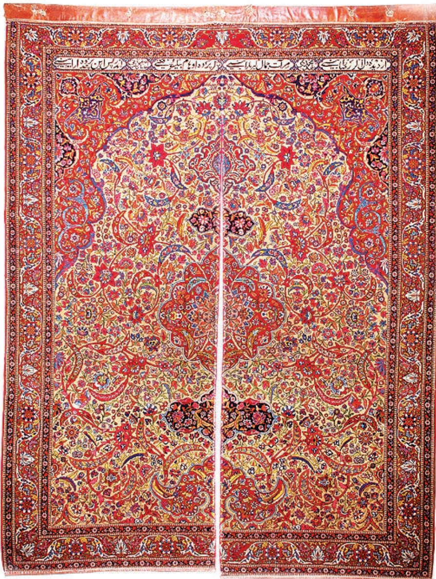
تصویر ۱: قالی پرده‌ای محرابی ترنج‌دار