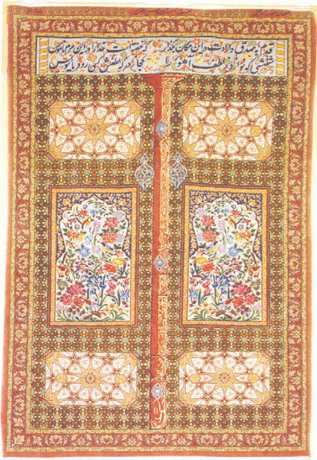
تصویر ۶: قالی درگه ضامن آهو