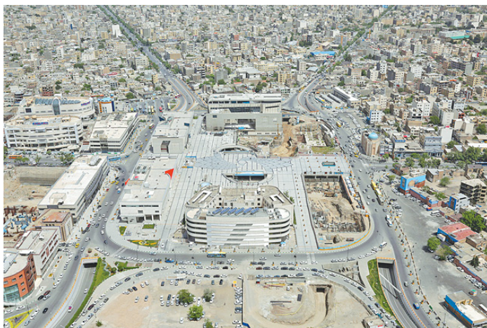
نمایی از میدان شهدا در سال ۱۳۹۵