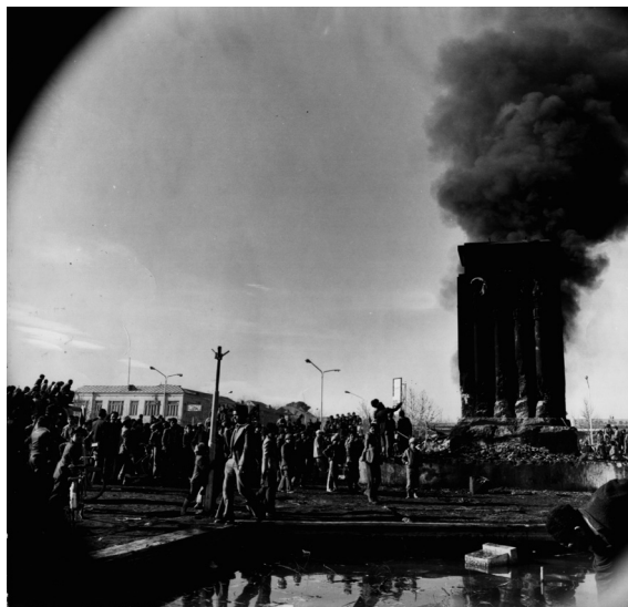
آتش‌زدن پایه‌های مجسمه رضاشاه در میدان شاه مشهد در دی‌ماه ۱۳۵۷

«۱۸ آذر ۱۳۵۷ به میدان جلو شهرداری رسیدیم که ملاحظه شد مجسمه رضاشاه که مدت چهل سال در میدان سوار بر اسب همچنان استوار بود با همه استحکامش همچون موم به دست مردم خورد و خمیر شده و پایین آورده‌اند و نمی‌دانم جنازه این مجسمه عظیم [را] که از برنز قیمتی بود و گویا در ایتالیا ساخته شده بود به کجا بردند که اثری از آن دیده نمی‌شد» (سیدقطبی، ۱۳۹۲، ص ۴۵). درگیری انقلابیون با نظامیان و شهادت حدود ۱۰ نفر در ماه‌های منتهی به انقلاب -به‌ویژه دی‌ماه- از حوادث تلخ میدان شاه است (جدول شماره ۲).