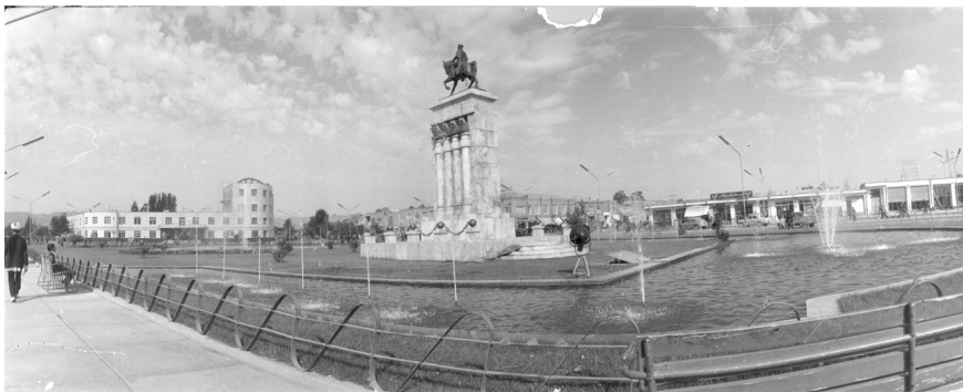
میدان شاه مشهد در دهه چهل