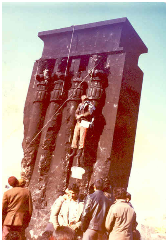
نمایش جنازه یکی از نظامیان در پایه مجسمه شاه دی ماه ۱۳۵۷