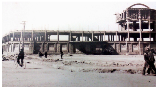
ساختمان شهرداری مشهد در حال ساخت در اواخر دوره رضاشاه