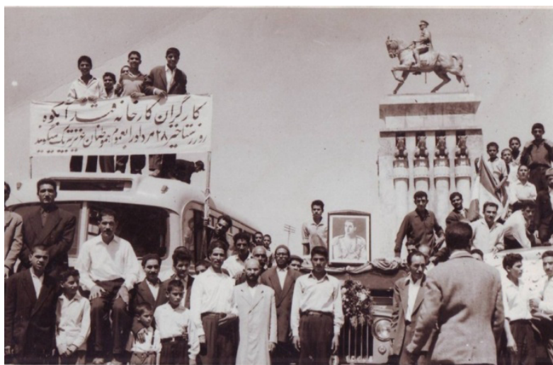
حضور کارگران در مراسم سالگرد ۲۸ مرداد در میدان شاه، دهه چهل

شرکت خدام آستان قدس در تظاهرات حمایت از لوایح شش‌گانه در ۲۹ دی ۱۳۴۱ (آفتاب شرق، سال ۳۸، شماره ۲۴۲)، برگزاری مراسم روز سوم اسفند در سال ۱۳۴۱ و نثار تاج گل به مجسمه (ساکماق، ۹۳۱۶۰/۷)، مراسم سالروز ۲۸ مرداد (خراسان، شماره ۴۹۵۴، سال ۱۸) و برگزاری جشن روز ارتش در ۲۱ آذرماه ۱۳۴۶ و رژه پادگان مشهد (ساکماق، ۴۹۲۵۶) برخی از برنامه‌هایی است که در دهه چهل در میدان شاه مشهد برگزار شد.