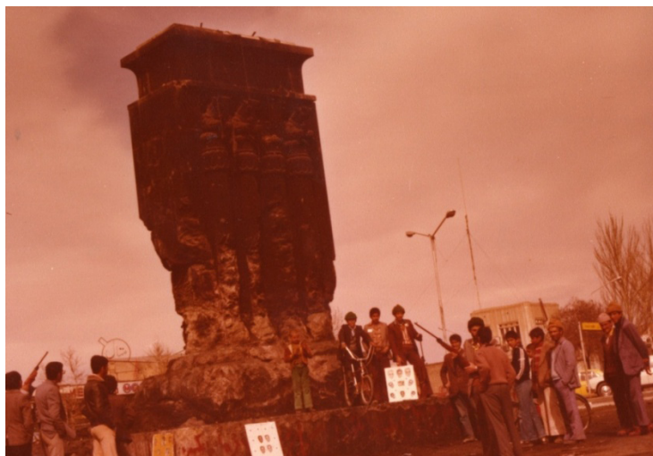
پایه‌های مجسمه شاه پس از آتش‌زدن در دی‌ماه ۱۳۵۷