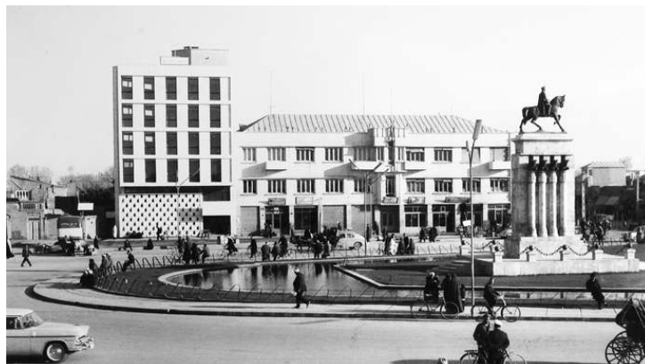
میدان شاه مشهد در اوایل دهه پنجاه