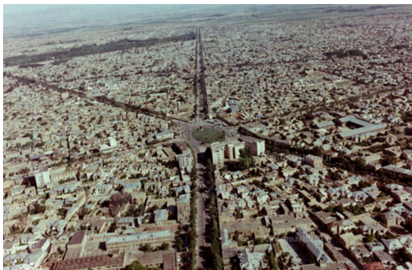
نمایی از میدان شاه دهه پنجاه