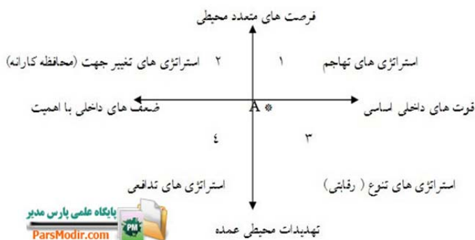
شکل شماره ۲: الگوی ارزیابی و انتخاب استراتژی

برای تجزیه و تحلیل هم زمان عوامل داخلی و خارجی از ماتریس داخلی و خارجی استفاده می‌گردد. این ماتریس برای تعیین موقعیت صنعت یا سازمان به کار می‌رود و برای تشکیل آن باید نمرات حاصل از ماتریس ارزیابی عوامل داخلی و ماتریس ارزیابی عوامل خارجی را در ابعاد عمودی و افقی آن قرار داد تا جایگاه صنعت یا سازمان در بازار مشخص گردد و بتوان استراتژی‌های مناسبی را برای آن مشخص کرد. این ماتریس منطبق بر ماتریس SWOT است و استراتژی‌های مناسب برای سازمان را مشخص می‌کند.