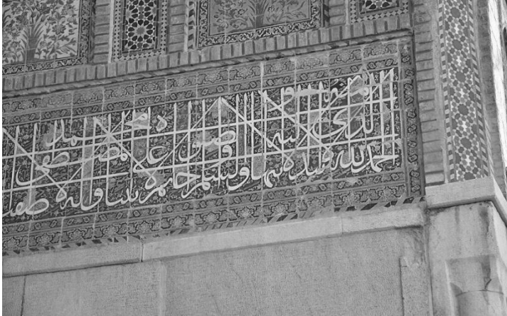
شکل ۳- کتیبه الوان سردر