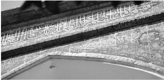
شکل ۵- احادیث حیات

حدیث و ۳۲ لقب وجود دارد. احادیث شاید به این دلیل که از نقل قول‌های قرآنی سازگارتر بودند، محبوب شدند و این احادیث از دوره صفوی بسیار مورد توجه واقع شدند (کاردار طهران، ۱۳۹۵، ص. ۵۸).