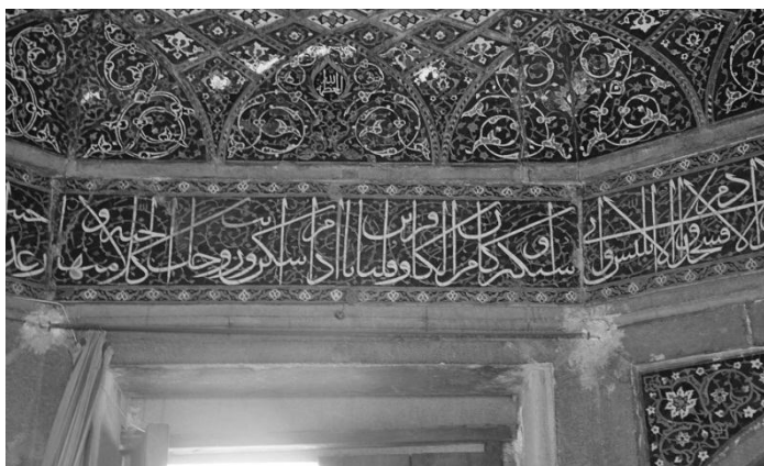
شکل ۴- کتیبه هشتی

بعد از سردر ورودی، هشتی مدرسه قرار گرفته که به وسیله دو راهرو به فضای مدرسه راه دارد. یکی از ویژگی های هشتی این مدرسه، نوشتن القاب خداوند دور تا دور آن می باشد که شامل ۸ لقب از جمله ((البقاء الله، العطاء الله، القدر الله، القوه الله، العظمه الله، العزه الله، الملك الله و الحمد الله)) است و همچنین قسمتی از سوره بقره که دوّمین سوره قرآن است نیز در هشتی و بر روی کاشی معرق کار شده که آیات ۳۱ تا ۳۷ را شامل می شود. هدف عمده سوره بقره هدایت انسان می باشد. این سوره از لحاظ محتوا هم از اصول عقاید سخن گفته و هم احکام مسائل عبادی، اجتماعی، سیاسی و اقتصادی را مطرح کرده است. در آخر آیات نام خطاط آن یعنی ((صیرفی)) آمده است. در گوشه ای از هشتی و بر روی کاشی معرق تاریخ اتمام مدرسه به سال ۱۰۲۴ نوشته شده که در این تاریخ مدرسه خان به دست امامقلی خان به اتمام می رسد.