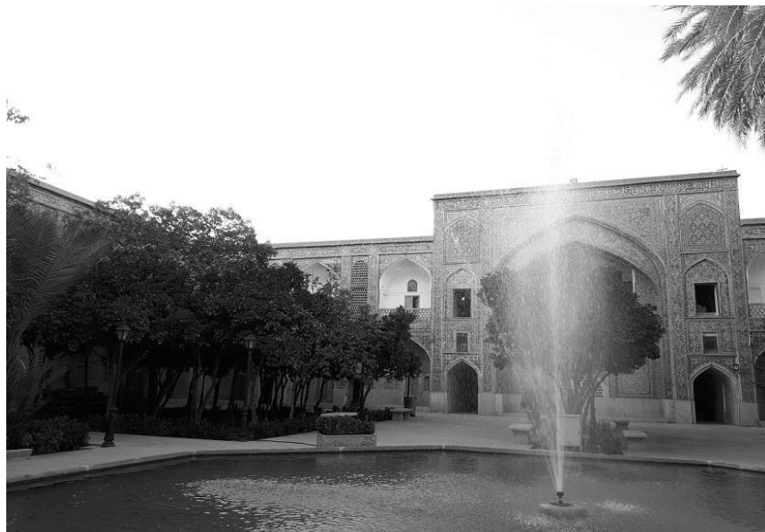
شکل ۱-مدرسه خان