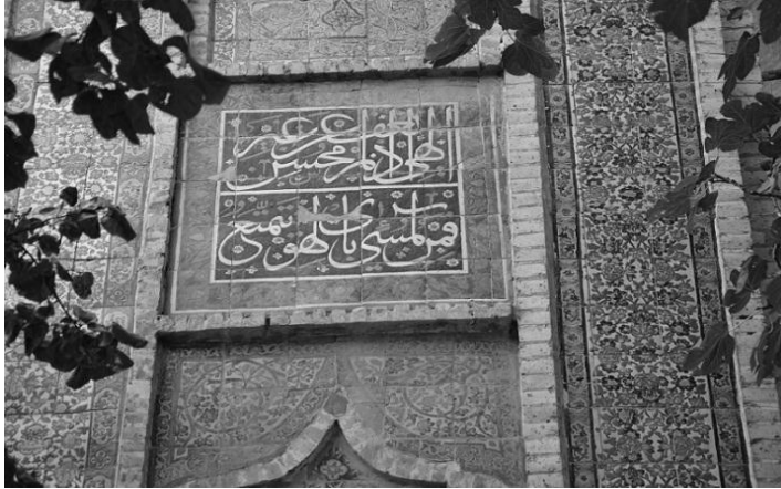
شکل ۷- مناجات نامه حضرت علی (ع)

الهی تری حالی و فقری و فاقتی و آنت مناجاتی الخفیه تسمع الهی إذا لم تعف عن غیر محسن فمّن لمسیء بالهوی یتمتع