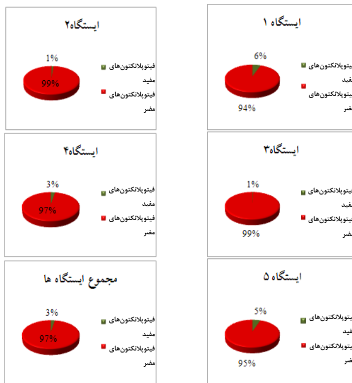
شکل ۲: نسبت تراکم گروه‌های فیتوپلانکتونی مفید به مضر در ایستگاه‌های مورد بررسی و نیز در مجموع اکوسیستم

همانطور که در جدول فوق قابل مشاهده است، معناداری مقادیر شاخه داینوفلاژله‌ها و باسیلاریوفیتا در ایستگاه‌های مختلف روند یکسانی را طی می‌کند. بر این اساس در ایستگاه‌های ۲ و ۳ عدم اختلاف معنادار ( p < 0/05 ) و در سایر ایستگاه‌ها اختلاف معنادار ( p > 0/05 ) در مورد هر دو گروه مشاهده می‌شود. شاخه اولگنلفایتا نیز در ایستگاه‌های ۳ و ۵ دارای اختلاف معنادار ( p > 0/05 ) و مقادیر بیشتری نسبت به سایر ایستگاه‌ها می‌باشد. همان‌طور که نتایج نشان می‌دهند، تراکم کلی فیتوپلانکتون‌ها در تمامی ایستگاه‌ها نسبت به هم دارای اختلاف معنادار می‌باشد ( p > 0/05 ).