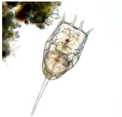
شکل ۳: زئوپلانکتون جنس Keratellacochlearis از دسته Rotifera (عکس‌برداری با استفاده از نمایشگر میکروسکوپ معکوس مدل Nikon (T1-SM))

در بررسی‌های انجام شده، تنها یک نمونه (۱ عدد) زئوپلانکتون جنس Keratellacochlearis از دسته Rotifera در ایستگاه ۴ مشاهده گردید که در شکل ۳ نشان داده شده است.