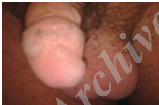
شکل ۱: همانژیوم گلنس پنیس

همانژیوم یک ضایعه عروقی خوش خیم است که از عروق مویرگی نابالغ تشکیل شده است. همانژیوم در ارگانهای مختلف گزارش شده اما در ژنیتالیا نادر است. فقط چند مورد از همانژیوم های گلنس پنیس تاکنون گزارش شده است. همانژیوم های گلنس پنیس معمولاً کوچک و بدون علامت هستند. احتمال خونریزی حین مقاربت گزارش شده است [۱]. در اغلب گزارشات، برداشت ضایعه با جراحی یا کرایوتراپی و یا لیزرتراپی توسط لیزر Nd:YAG برای درمان این ضایعات مطرح شده است. در این مطالعه یک مورد همانژیوم گلنس پنیس را معرفی می کنیم که تحت اسکروتراپی با کمک سدیم تترادسیل سولفات ۳٪ (TROMBOVAR) قرار می گیرد.