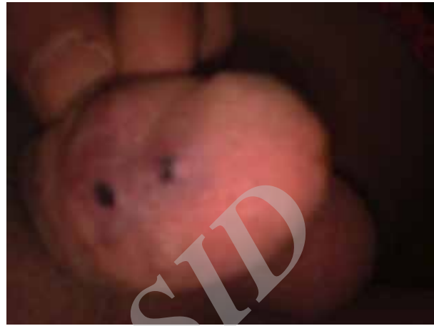
شکل ۳: یک هفته بعد از اسکروتراپی

اسکروتراپی توسط سدیم تترادسیل سولفات ۳% (TROMBOVAR) انجام شد (شکل ۳). سونوگرافی کالرداپلر یک هفته بعد از تزریق ماده اسکروزان هیچگونه جریان عروقی را نشان نداد (شکل ۴).