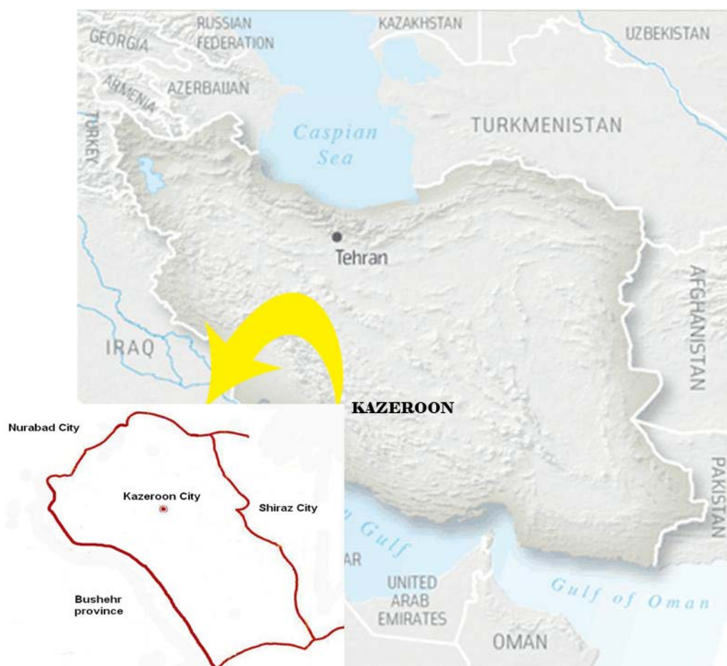
تصویر ۱. موقعیت جغرافیایی شهرستان کازرون (Rezaei, 2012).

جدول ۱. محوطه‌های مورد بررسی دشت کازرون و ساختار فناوریانه ابزارهای سنگی یافت شده (رضایی، ۱۳۹۰: ۲۹۳).