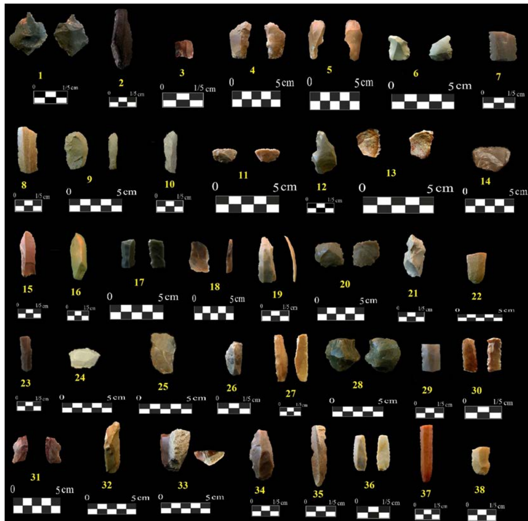
تصویر ۳. نمونه ابزارهای سنگی یافت شده از محوطه‌های پیش از تاریخ دشت کازرون (نگارنده، ۱۳۹۶).

مایل به قرمز، یک قطعه انتهایی proximal تیغه کنگره‌دار از چرت کرم مایل به عسلی، یک قطعه انتهایی proximal تیغه با جلای داس از چرت قهوه‌ای مایل به قرمز، سه قطعه بخش میانی تیغه استفاده شده از چرت حرارت دیده، چرت خاکستری تیره و چرت عسلی (تصویر ۳-۳۸-۳۳). فراوانی قطعات تیغه و وجود آثار جلای داس در برخی قطعات به همراه وجود قطعات کنگره‌دار نشان دهنده محوریت گیاهان در معیشت غذایی مردمان این محوطه است. اما همچون سایر محوطه‌ها هیچ سنگ مادر تیغه/ریزتیغه‌ای در مجموعه این محوطه دیده نمی‌شود. سنگ مادرهای این محوطه به همراه دورریز و تراشه‌های چپ از جنس چرت خاکستری سبز هستند، اما ابزارهای مجموعه تنوع ماده خام بالایی را نشان می‌دهند که عمدتاً شامل چرت در طیف رنگی عسلی و قهوه‌ای به همراه چرت عسلی مایل به قرمز است.