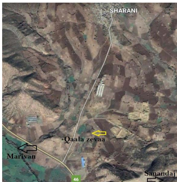
تصویر ۳. موقعیت نسبی تپه قاله زیوا.

ابعاد و اندازه این تپه حدوداً 70 \times 70 متر و ارتفاع آن از سطح دره جلگه ای دامنه غربی تپه حدوداً ۵ متر است (تصاویر ۴ و ۵) سطح تپه هم اکنون کاربری کشاورزی دارد و به گفته مالک این زمین، رأس تپه در گذشته ارتفاع بیش تری داشته و جهت تسهیل در امر کشاورزی سطح آن را حدود ۱ متر تسطیح کرده اند. همچنین از عمق ۸۰ - سانتی متری رأس تپه لوله آبرسانی عبور کرده است. با توجه به این توصیفات و آسیب های وارد شده به این اثر ارزشمند می توان گفت که وضعیت حفاظتی آن در شرایط نه چندان مطلوب قرار دارد و لازم به ذکر است که متأسفانه در فهرست آثار ملی به ثبت نرسیده است.