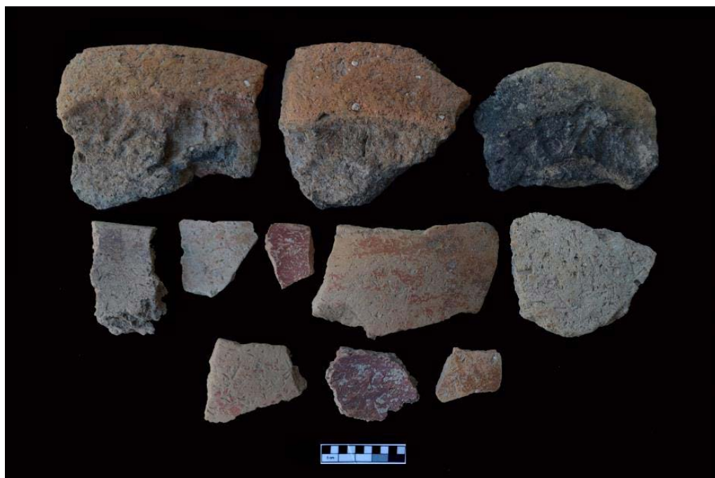
تصویر ۷. سفال‌های نوسنگی جدید؟ تپه قاله زیوا (نگارندگان).