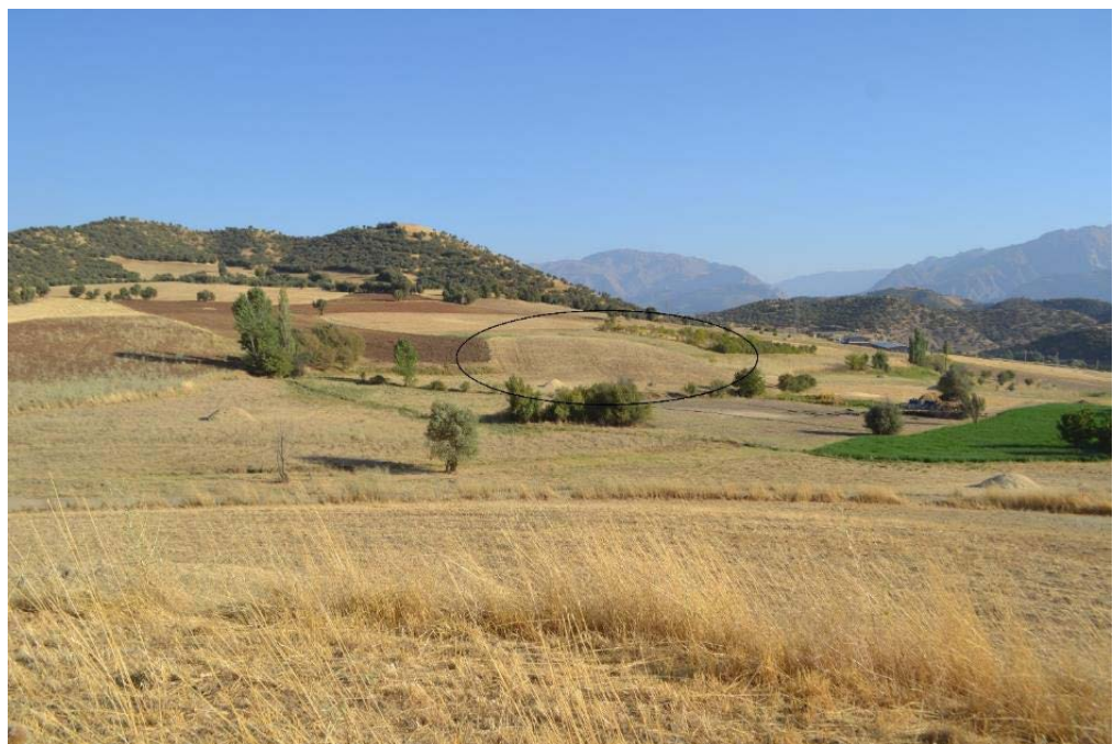
تصاویر ۴ و ۵. دورنمای تپه (نگارندگان).

سفال های نوع سراب جدید نیز از بررسی تپه به دست آمدند (تصویر ۷). پوشش های گلی براق سطح این چند قطعه بسیار شبیه به پوشش سفال های گونه سراب جدید منطقه زاگرس مرکزی و از جمله خود تپه سراب کرمانشاه بوده، ولی به دست نیامدن دیگر گونه های شاخص سفالی دوره نوسنگی جدید نظیر سفال های منقوش این دوره نظیر سفال خطی سراب باعث می شود که در انتساب این گونه سفالی به دوره نوسنگی جدید با شک و تردید مواجه شویم و با آن قاطعیتی که از وجود سفال نوع جی در این تپه سخن به میان آورده ایم، سخن نگوئیم. به هر حال با توجه به قرابت زمانی تقریباً نزدیک به هم سفال جی با سفال گونه سراب جدید (نیمه دوم هزاره ششم ق.م.) وجود دوره نوسنگی جدید در این تپه نیز زیاد دور از ذهن نمی تواند باشد. خوشبختانه شواهد سفالی تپه قاله زیوا تنها محدود به دوره نوسنگی جدید؟ و مس سنگی قدیم نیست، بلکه سفال های شاخص مرحله ابتدایی دوره مس سنگ میانی (دالما) را نیز دارد (تصویر ۸). آن چه که ما را مطمئن می سازد که سفال های این مرحله فقط متعلق به مرحله ابتدایی مس سنگی میانی است، به دست نیامدن سفال های نخودی منقوش مرحله میانی مس و سنگی میانی نظیر سفال