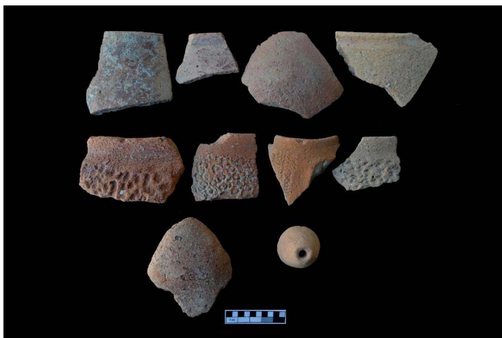
تصویر ۸. سفال‌های دالمایی تپه قاله زیوا (نگارندگان).

و شریفی، ۱۳۹۷ و زارعی و همکاران، ۱۳۹۶). اما در مورد دوره‌های نوسنگی و مس‌سنگی قدیم وضعیت به این‌گونه نیست و محوطه‌های کمتری از این دوران گزارش شده‌اند. خوشبختانه گزارش دو محوطه دوره نوسنگی در مریوان و یا کاوش تپه قشلاق بیجار (مترجم و شریفی، ۱۳۹۷) باب جدیدی را در مطالعات دوره نوسنگی منطقه آغاز کرده و نتایج جالبی را نیز به دست داده‌اند.