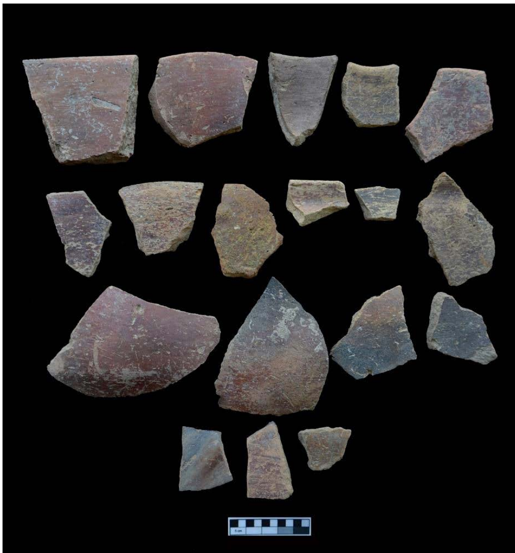
تصویر ۶. سفال‌های جی از تپه قاله زیوا.

گونه سه‌گابی و B.O.B است. بنابراین آن‌گونه که از شواهد سفالی مشخص است، تپه قاله زیوا از جمله محدود تپه‌های پیش‌ازتاریخ نه‌تنها مریوان، بلکه کل منطقه است که شواهد هر سه دوره نوسنگی جدید؟، مس‌سنگی قدیم و مرحله ابتدایی مس‌سنگی میانی را داراست و لایه‌نگاری آن می‌تواند بسیاری از ابهامات گاه‌نگاری اواخر نوسنگی و اوایل مس‌سنگی منطقه را پاسخگو باشد.