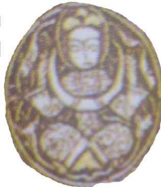
شکل ۶. مضمون «سلطان به صورت چهار زانو و هلال ماه در دست» نقش‌پردازی شده در آثار موصلی (وارد، ۱۳۸۴: ۸۳).