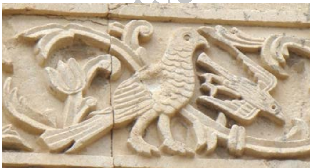
تصویر ۱۵. نقش کبوتر در میان نقوش ردیف دوم قره‌کلیسا (نگارندگان، ۱۳۹۷).

مجسمه‌هایی که از کبوتر و قمری در خوزستان و جاهای دیگر ایران پیدا شده، همگی رمزی از ناهیدند. در انجیل مرقس (باب اول فقره ۱۰) آمد که چون عیسی از آب برآمد، دید که آسمان شکافته شد و روح مانند کبوتر بر روی فرود آمد. در انجیل متی باب سوم فقره ۱۶ نیز آمده که چون عیسی غسل تعمید یافت، فوراً از آب برآمد و آنگاه آسمان بروی گشاده شد و او دید که روح خداوند مانند کبوتر فرو آمد و بر روی درآمد. به همین جهت از کبوتر به عنوان نماد روح القدس و پیک صلح و صفا و نماد عشق و عصمت استفاده می‌شود (یا حقی، ۱۳۸۶: ۶۶۲-۶۶۱).