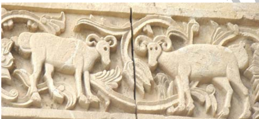
تصویر ۹. نقش قوچ در ردیف سوم (بخش بالایی) قره‌کلیسا (نگارندگان، ۱۳۹۷).

قوچ: در تصویر ۹ در میان نگاره‌های ردیف سوم قره‌کلیسا، نقش دو قوچ ارائه شده است. در این نقش دو قوچ درحالی درمقابل هم قرار گرفته‌اند که یکی از آن‌ها به صورت نیم‌رخ و دیگری تمام‌رخ به صورت ایستاده حجاری شده‌اند. نقش این جانوران به صورت طبیعی نشان داده شده و از روی شاخ‌های پیچیده و دمبه آن‌ها قابل تشخیص هستند.