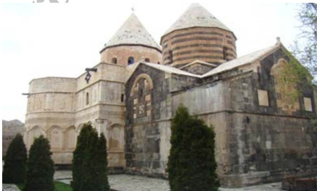
تصویر ۲. نمایی از ضلع شمالی قره‌کلیسا.

بیشترین نقوش جانوری قره‌کلیسا در ردیف سوم حجاری شده است. این نقوش همان‌هایی هستند که به‌طور مستقیم انسان به شکار آن‌ها پرداخته و یا به‌نحوی با موضوع شکار و زندگی روزمره شکارچیان در ارتباط بوده و یا ریشه در ادیان گذشته داشته و بیشتر جنبه اعتقادی و باوری دارند. این نگاره‌ها از نظر فراوانی و تعداد به‌ترتیب ذیل قابل تفکیک هستند که در ادامه به معرفی آن‌ها می‌پردازیم.