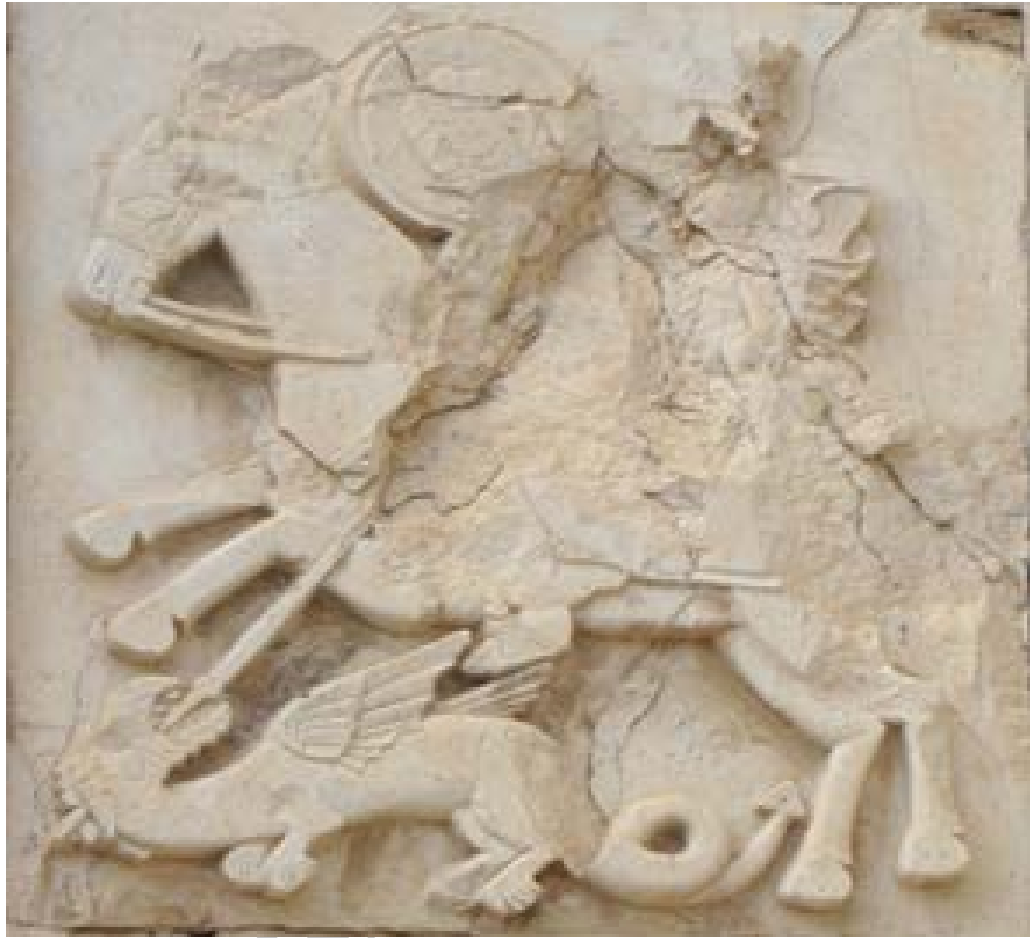
تصویر ۴. نقش ازدها زیر پای فرد سواره (نگارندگان، ۱۳۹۷).

به سبب داشتن بصیرت، اغلب نقش هشداردهنده به موقع به ارباب خود ایفا می‌کند. یونگ اسب را نمادی از مادر درونی و دریافت درونی و اشراقی انسان می‌داند. وی همچنین اسب را هم به نیروهای پست انسان و هم به آب ارتباط می‌دهد (سرلو، ۱۳۸۸: ۱۳۴-۱۳۲).