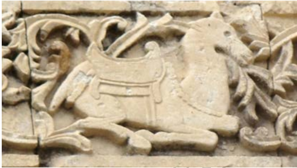
تصویر ۷. نقش شتر در ردیف سوم (بخش بالایی) قره‌کلیسا (نگارندگان، ۱۳۹۷).

شیر: در پایه‌های برج ناقوس قره‌کلیسا، دو شیر نقش شده یکی از شیرها به صورت ایستاده با دم برگشته به پشت، در حال حرکت بوده و دیگری نقش شیر با خورشید را نشان می‌دهد. در این نقش شیر نشسته و دو دست خود را بر روی هم انداخته و بر پشت آن تصویر خورشید ارائه شده است (تصویر ۸).