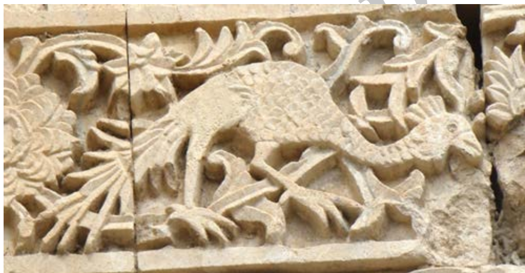
تصویر ۱۳. نقش طاووس بر روی نمای قره‌کلیسا (نگارندگان، ۱۳۹۷).

طاووس در دوران باستان در آیین زرتشت به‌عنوان مرغی مقدس مورد توجه بوده است (خزایی، ۱۳۹۰: ۱۳۹). این پرنده در ایران باستان نیز به‌عنوان مرغ ناهید (آناهیته، ایزد آب) مطرح بوده است (پرهام، ۱۳۷۱: ۵).