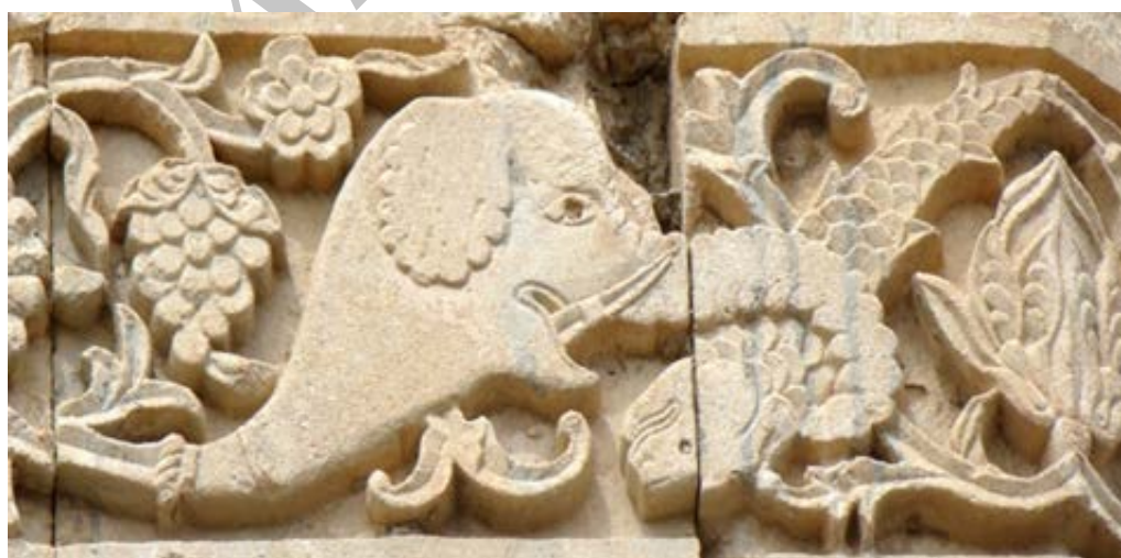
تصویر ۱۲. نقش ماهی در ردیف سوم (بخش بالایی) قره‌کلیسا (نگارندگان، ۱۳۹۷).

ماهی یکی از نشانه‌های مسیحیت در قرون اولیه مسیحیت بود و افراد برای شناسایی هم، مانند رمزی از آن استفاده می‌کردند. این نشانه در قلمرو نمادشناسی مظهر حاصل خیزی و باروری