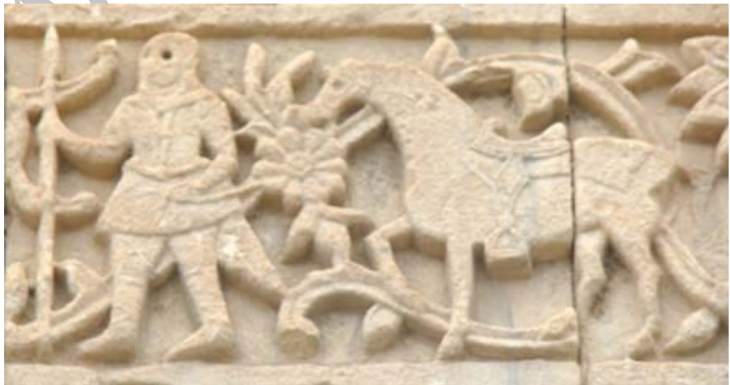
تصویر ۵. نقش اسب در ردیف سوم قره‌کلیسا (نگارندگان، ۱۳۹۷).

به سبب داشتن بصیرت، اغلب نقش هشداردهنده به موقع به ارباب خود ایفا می‌کند. یونگ اسب را نمادی از مادر درونی و دریافت درونی و اشراقی انسان می‌داند. وی همچنین اسب را هم به نیروهای پست انسان و هم به آب ارتباط می‌دهد (سرلو، ۱۳۸۸: ۱۳۴-۱۳۲).