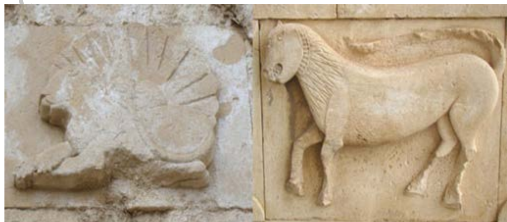
تصویر ۸. نقوش شیرهای حجاری در پایه برج ناقوس و ردیف دوم نمای قره‌کلیسا (نگارندگان، ۱۳۹۷).

شیرها نگهبانان نمادین پرستش‌گاه‌ها و قصرها بوده‌اند. پیدا شدن شیر در هنر مصر، بین‌النهرین و ایران باستان نشان می‌دهد که این حیوان روزگاری در این مناطق می‌زیسته است (هال، ۱۳۸۰: ۶۱). علاوه بر اینکه ایرانیان آن را نشان پنجم از برج‌های آسمانی (اسد) می‌دانسته‌اند، در آیین مهری، شیر با آتش در ارتباط بوده و مراقبت از شعله مقدس آتشدان را برعهده داشته است (هیلنز، ۱۳۸۵: ۱۳۵).