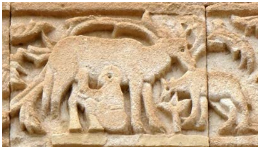
تصویر ۱۱. نقش گاو در ردیف سوم نگاره‌های قره‌کلیسا (نگارندگان، ۱۳۹۷).

نو، مظهر مرگ زمستان و تولید نیروی حیات آفریننده است (کوپر، ۱۳۸۰: ۳۰۱). علاوه بر گاو نر، در بسیاری از ادیان باستانی، ماده‌گاو به عنوان سرچشمه لقاح و آبستنی، پس از ورزا (گاو نر)، مقام دوم را در قدرت زایایی به دست آورده است. از این رو ماده‌گاو را نیز همچون وزرا می‌پرستیده‌اند (وارنر، ۱۳۸۶: ۵۰۹).