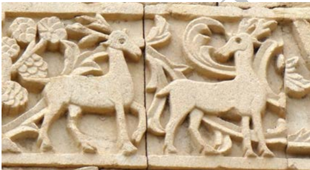
تصویر ۱۰. نقش گوزن در ردیف سوم نگاره‌های قره‌کلیسا (نگارندگان، ۱۳۹۷).

گوزن نر همانند عقاب و شیر، دشمن دنیوی مار است که از جهت نمادین نشانه مطلوبیت اوست و ارتباط نزدیک با نور و آسمان دارد. گوزن را نمادی از تعالی نیز دانسته‌اند. گوزن نماد نیک‌اندیشی است که با شرق، طلوع، نور، پاکی، تولد دوباره، خلاقیت، باروری و معنویت مرتبط است. بخشی از ابهت گوزن به سبب شکل ظاهری، زیبایی، وقار و چابکی آن است. نقش پیام‌آور خدایان را نیز دارد (سرلو، ۱۳۸۸: ۶۶۳-۶۶۲).