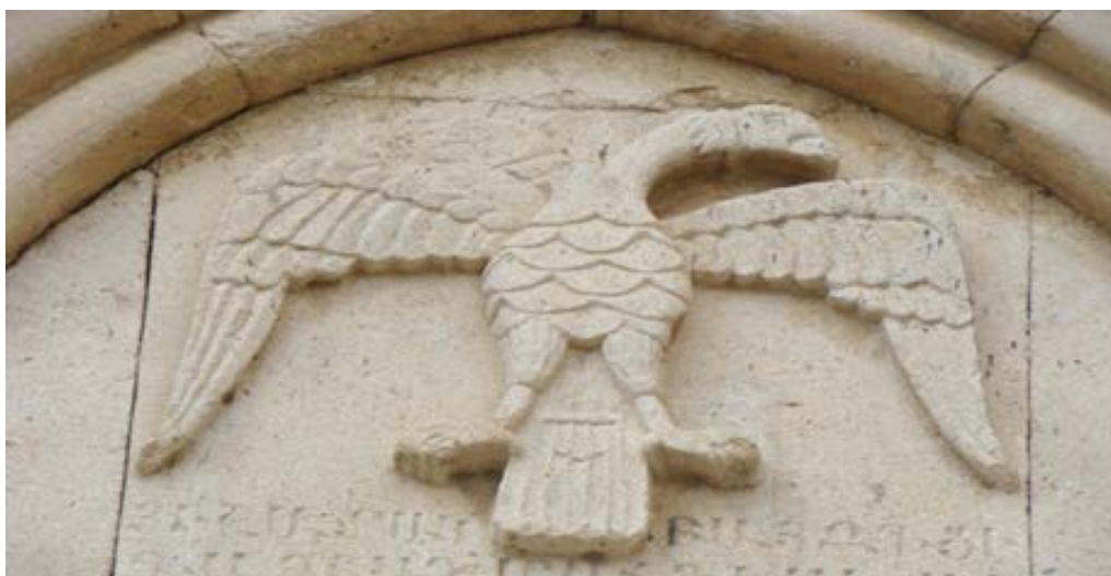
تصویر ۱۴. نقش عقاب بر روی نمای قره‌کلیسا (نگارندگان، ۱۳۹۷).

مجسمه‌هایی که از کبوتر و قمری در خوزستان و جاهای دیگر ایران پیدا شده، همگی رمزی از ناهیدند. در انجیل مرقس (باب اول فقره ۱۰) آمد که چون عیسی از آب برآمد، دید که آسمان شکافته شد و روح مانند کبوتر بر روی فرود آمد. در انجیل متی باب سوم فقره ۱۶ نیز آمده که چون عیسی غسل تعمید یافت، فوراً از آب برآمد و آنگاه آسمان بروی گشاده شد و او دید که روح خداوند مانند کبوتر فرو آمد و بر روی درآمد. به همین جهت از کبوتر به عنوان نماد روح القدس و پیک صلح و صفا و نماد عشق و عصمت استفاده می‌شود (یا حقی، ۱۳۸۶: ۶۶۲-۶۶۱).