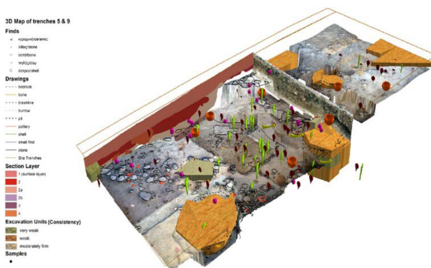
تصویر ۲. ترکیبی از قسمت‌های مختلف بافت یک کارگاه شامل واحدهای کاوش، مواد باستانی، نقشه‌ها و عکس‌ها (Katsianis et al., 2008).