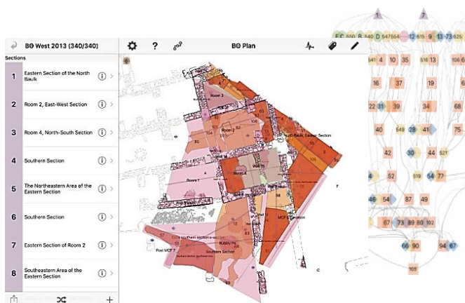
تصویر ۱. پردازش شده توسط نرم افزار ای دیگ ۲۳ (نگارندگان، ۱۳۹۸).