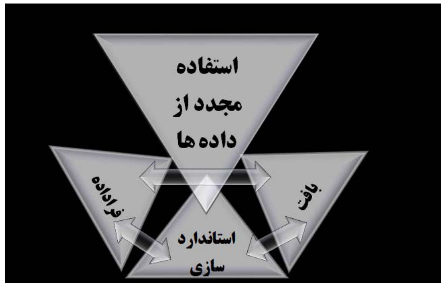
مدل ۱. استفاده از ابزارهای استفاده مجدد از اطلاعات در مراحل پژوهش عملی (نگارندگان، ۱۳۹۸).

سازمان‌های کلان در زمینه مدیریت داده‌ها وجود دارد. سازمان ۱۸ تی دار ۱۹ و سرویس اطلاعات باستان شناسی بریتانیا، ای دی اس ۲۰ ، با هدف دسترسی آزاد به اطلاعات و فراداده‌های استاندارد، برنامه‌ریزی‌های کلان برای توسعه میانی نظری و استانداردسازی اطلاعات اولیه مانند تاریخ‌گذاری و فراداده‌ها (که شامل اطلاعات بافت نیز می‌شود) را آغاز کرده‌اند. محققان می‌توانند براساس دانش خود صحت و اعتبار اطلاعات موجود در پایگاه اطلاعاتی را بررسی کنند. پایگاه اطلاعات آزاد «آرکید» ۲۱ برای شناسایی محققان ایجاد شده است، با استفاده از ای پی آی وب آرکید برای نمایش اطلاعات بیوگرافی و انتشار اطلاعات در مورد مشارکت‌کنندگان در گردآوری اطلاعات، پایگاه اطلاعات آزاد، داده‌های جدیدی را در مورد تخصص و اعتبار باستان‌شناسان گردآورنده اطلاعات، ارائه می‌کند ۲۲ . این سازمان این فراداده‌ها را در قالب چارچوب استاندارد مشخص ارائه می‌کند. نمود دیگری از تعاملات این زمینه‌ها در پایگاه داده‌های اطلاعاتی است که به سبب ماهیت عملکردی، استانداردسازی و استفاده از فراداده‌ها را در برمی‌گیرد.