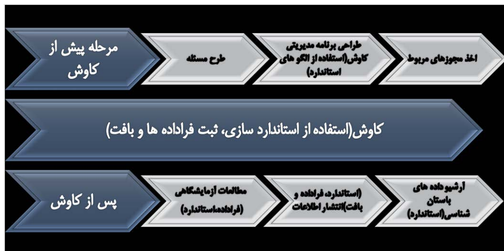
مدل ۲. ارتباط مؤلفه‌های اصلی در استفاده مجدد از داده‌ها (نگارندگان، ۱۳۹۸).