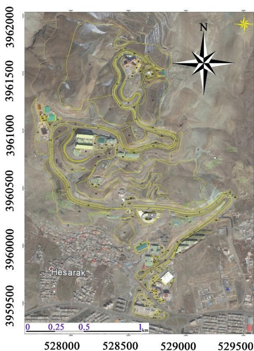
شکل ۱- عکس هوایی از سایت دانشگاه آزاد اسلامی واحد علوم و تحقیقات تهران

۵۹' تا ۳۹° و ۶۲' عرض شمالی واقع شده است. جهت جمع‌آوری اطلاعات از دو روش کتابخانه‌ای و پیمایشی استفاده شد. جهت تدوین مبانی نظری از روش کتابخانه‌ای (مقالات و کتب الکترونیک و غیرالکترونیک) و برای گردآوری داده‌ها از روش میدانی با مراجعه به کتابخانه و اسناد علمی دانشگاه آزاد اسلامی واحد علوم تحقیقات تهران و پیمایش فضای سبز استفاده شد. نقشه منطقه با استفاده از عکس‌های هوایی منطقه، انجام پیمایش زمینی توسط کارشناسان طرح و برداشت مختصات نقاط با استفاده از دستگاه GPS به‌روز شده و جهت قطعه‌بندی مورد استفاده قرار گرفت (شکل ۱).