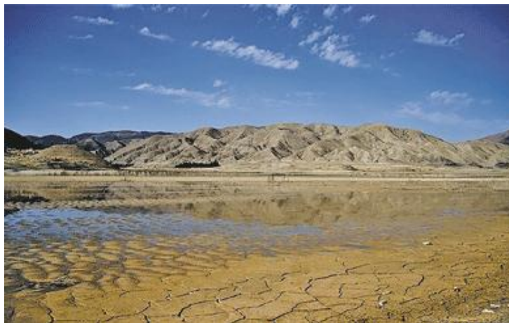
شکل ۲. پدیده خشک شدن تالاب پارک بشیر در جنوب استان سیستان و بلوچستان