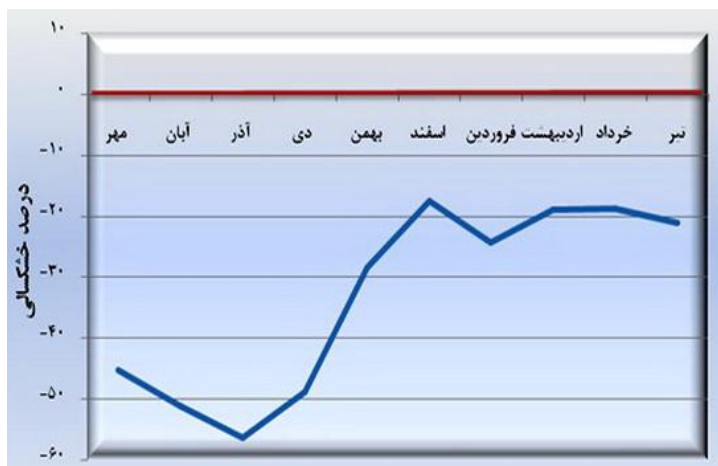
شکل ۳. مقایسه درصد تغییرات میزان بارش از ابتدای مهرماه تا تیرماه ۱۳۹۴ با متوسط دراز مدت آن در استان سیستان و بلوچستان