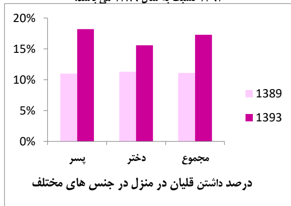
شکل ۲- درصد داشتن قلیان در منزل در سال های ۱۳۸۹ و ۱۳۹۳ به تفکیک جنس