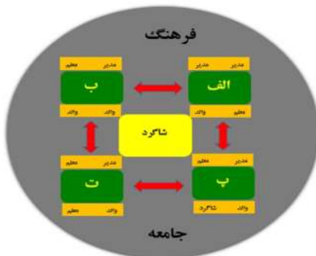
شکل ۳. زیاهنگ‌های آموزشی اطراف دانش‌آموز در محیط آموزش برگرفته از پیش‌قدم و ابراهیمی (۱۴۰۰: ۳۹)

بر اساس شکل فوق، دانش‌آموزان در محیط آموزشی در طول تعامل با هم‌کلاسی‌ها، معلمان، مدیر و والدین بازخوردهایی در قالب شفاهی و یا نوشتاری دریافت می‌کنند که موجب رشد و یا بازدارندگی آنان می‌شود؛ در واقع این بازخوردها نقش مؤثری در اهداف آموزشی، ارزشیابی تحصیلی و کیفیت یادگیری دانش‌آموزان دارد. این تعاملات میان افراد فعال در حوزه آموزش، زمینه‌ساز شکل‌گیری زیاهنگ آموزشی می‌شود که تحلیل و بررسی آن‌ها بسیاری از ناگفته‌های آموزشی را مشخص می‌کند (پیش‌قدم و ابراهیمی، ۱۴۰۰: ۳۹).