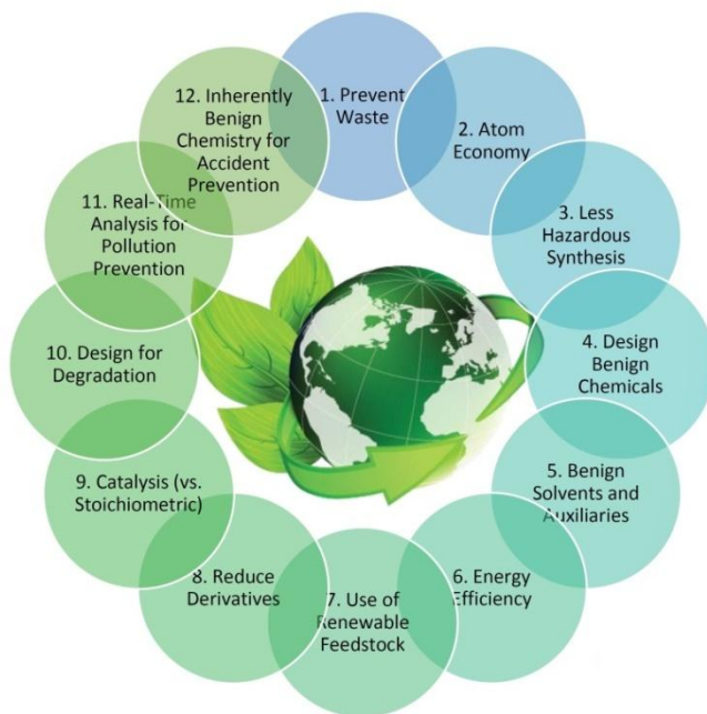
شکل ۲. اصول ۱۲ گانه شیمی سبز

اگرچه مقالات زیادی در مورد شیمی سبز و توسعه پایدار در سطح بین‌المللی و در کشور ما منتشر شده و این روند همچنان رو به افزایش است، در زمینه آموزش شیمی سبز کار کمتری صورت گرفته است. با توجه به تعداد زیاد جمعیت دانش‌آموزان و دانشجویان در کشورمان و پتانسیل بالای موجود برای کار در زمینه‌های زیست‌محیطی، به نظر می‌رسد که با سرمایه‌گذاری بر روی بخش آموزش شیمی سبز در مدارس و دانشگاه‌ها و سپس در سطحی وسیع‌تر در جامعه، بتوان به توسعه شیمی سبز در جامعه و به تبع آن به توسعه پایدار کمک شایانی نمود. در مقاله حاضر پس از بررسی چالش‌ها و فرصت‌هایی که در این زمینه وجود دارد، مروری بر برخی از جدیدترین روش‌های آموزشی به کار رفته در سطح بین‌المللی برای آموزش شیمی سبز خواهیم داشت.