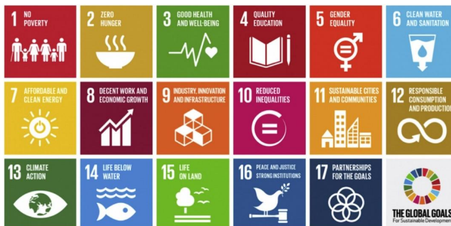
شکل ۱. اهداف ۱۷ گانه SDG

اصطلاح شیمی پایدار در حدود همان دهه ۱۹۹۰ و به‌طور عمده در اروپا پدید آمد. در برخی از مقالاتی که به‌تازگی منتشر شده است به‌جای این که شیمی سبز یک شرط عملی و فنی لازم برای شیمی پایدار باشد، به‌عنوان مسیری جهت ارائه ابزار علمی برای شیمی پایدار توصیف شده است. به‌عبارتی، شیمی پایدار دامنه شیمی سبز را توسعه می‌بخشد تا ملاحظات اجتماعی، اقتصادی و زیست‌محیطی را نیز در بر بگیرد. در حالی که شیمی سبز دستیابی به این اهداف را از نظر فنی تضمین می‌کند (آناستاز و زیمرمن، ۲۰۱۸، ص. ۱۵۰).