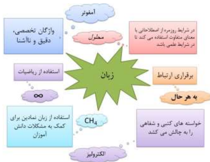
شکل ۳: ماهیت چندوجهی زبان علم (خاویر گارسیا و النا سرانو، ۲۰۱۵، ص. ۴۳۰ و ۴۳۱)