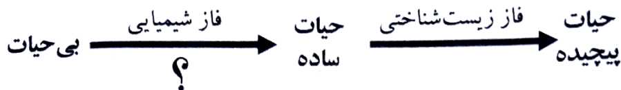
شکل ۱. تبدیل دو فازی (شیمیایی و زیست‌شناسی) بی‌حیات به حیات پیچیده

حیات با آنکه پدیده‌ای فوق‌العاده پیچیده است اما اصل آن به طرز شگفتی آوری ساده است. حیات تنها عبارت است از شبکه‌ی برآیندی واکنش‌های شیمیایی که چرخه‌ی پی در پی تکرارشدن، جهش، پیچیده‌گی‌یافتگی و گزینش، پدید می‌آید. در مدتی پس از شکل‌گیری منظومه‌ی خورشیدی خودمان در حدود ۴/۶ میلیارد سال پیش، حیات روی زمین از سرآغازهایی نازیستی به راه افتاد. بنابراین، باور داریم که حیات روی زمین از ماده‌ی بی‌حیات پدیدار شده است (شکل ۱).