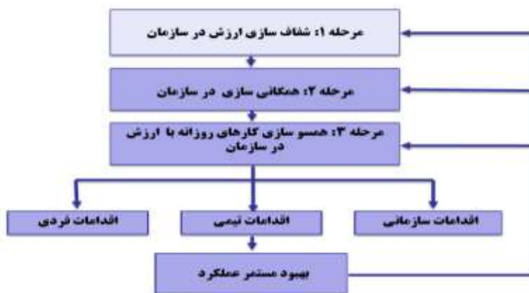
شکل شماره ۱: گام های مدیریت ارزش (به نقل از بلانچارد و اوکانر، ۱۳۸۴)

مدیریت مبتنی بر ارزش یک چارچوب عمومی و کلی را فراهم می کند که از طریق آن مدیران می توانند استراتژی ارزش گذاری را در داخل سازمان ها تعریف، پیاده سازی و اعمال کنند و با فراهم کردن صاحبان اطلاعاتی با ابزارهایی برای نظارت و هماهنگ کردن اقدامات مدیریتی عمل کنند و باید بیان کرد که ویژگی کلیدی مدیریت ارزش، شاخص های مبتنی بر ارزش است (کاپلند ۱ ، ۲۰۰۲). اندیشمندان مدیریت چنین مطرح می نمایند که سیر تکاملی مدیریت ارزش از سال ۱۹۶۸ تاکنون حاصل بوجود آمدن چهار روند سازمانی در دهه های اخیر بوده است، که این روندها سازمان ها را ملزم کرده اند تا به منظور حفظ و نگهداشت قابلیت های رقابتی در بسترهای محیطی اجتماعی و غیرقابل پیش بینی امروزی خود را با شرایط جدید سازگار نمایند که این روندها عبارتند از: ضرورت بهبود کیفیت و مشتری مداری، ضرورت - تخصص گرایی، استقلال عمل و پاسخگویی در میان کارکنان، ضرورت تبدیل «رئیسان» به - رهبران و تسهیل کنندگان، ضرورت ایجاد ساختار های سازمانی تخت تر و چالاک تر (قدمی، ۱۳۹۳). خصوصیات برجسته مدیریت بر مبنای ارزش عبارتند از اینکه: این رویکرد مدیریتی فقط برنامه نبوده، بلکه دیدگاهی متفاوت در خصوص روش و شیوه زیستن در سازمان ها به شمار می آید، به دنبال مسأله یابی می آید و نه حل مسأله، این رویکرد مدیریتی در طی -