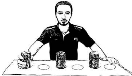
شکل ۱. تصویر آزمون هماهنگی

مقایسه نقش بازی‌های مجازی ... (مهتا اسکندرنژاد و بابک پوشش) ۷۳