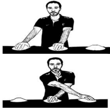
شکل ۳. آزمون ضربه زدن اندام فوقانی

یوروفیت (Eurofit Fitness Testing Battery) می‌باشد. برای انجام این آزمون به دو کلاهک و یا دیسک کوچک نیاز داریم که در فاصله ۶۰ سانتیمتری از هم بر روی یک میز قرار داده می‌شوند. یک مانع کوچک ۳۰ در ۲۰ سانتیمتری در وسط این مسیر قرار گرفته و دست غیربرتر بر روی آن نهاده می‌شود. فرد باید با حرکت دست برتر از بالای دست دیگر فاصله هر دو دیسک را طی کرده و به آنها ضربه بزند. زمان طی شده در تکمیل ۲۵ پرچه کامل حرکت (۵۰ ضربه) مبنای محاسبه قرار خواهد گرفت و نتایج ثبت می‌شود (اسکندر نژاد، ۱۳۹۴: ۱/ ۹۷-۹۸).