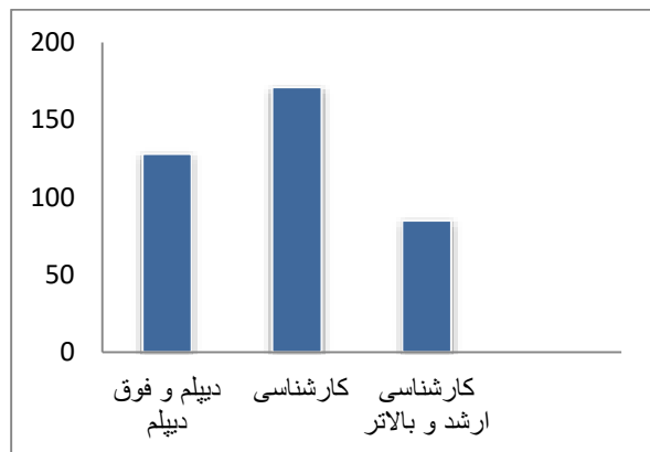
نمودار (۲): توزیع سطح تحصیلات